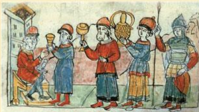
Греки платятъ дань Олегу. Радзивилловская летопись.

1. «Мы отъ рода Рускаго, Барлы, Пнегелъ, Фарлоуъ, Веремудъ, Рулавъ, Гуды, Руадъ, Баризъ, Фрелавъ, Рюаръ, Актеву, Труанъ, Лидуль-юсть, Стемидъ, иже послаи отъ Олга великаго князя Рускаго, и отъ всѣхъ, иже суть подъ рукою его, свѣтлыхъ бояръ, къ вамъ, Львови и Александру и Костянтину, великимъ о Бозѣ самодержьцемъ, царемъ Грецкимъ, (2) на удержаніе и