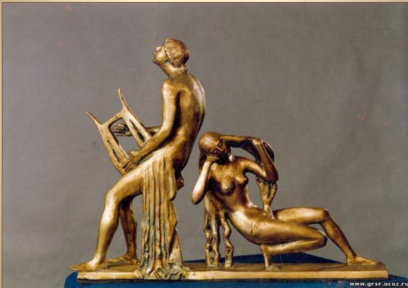
Парфёнов А.С. Орфей и Эвридика (бронза).