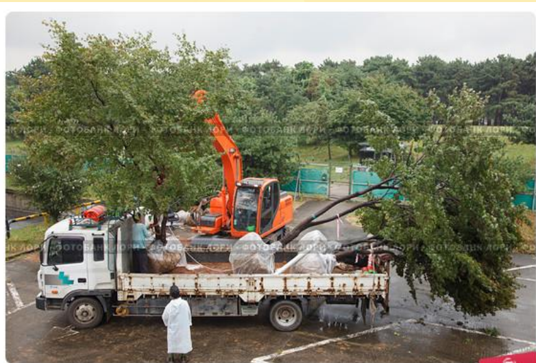
Кран грузит выкопанные деревья саженцы на грузовик для транспортировки