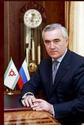
Мура́т Магоме́тович Зя́зиков