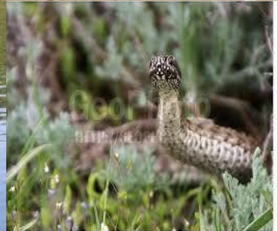
8 Apr 2008-0524 The Nagels Lake, European Russia, spring blossoming