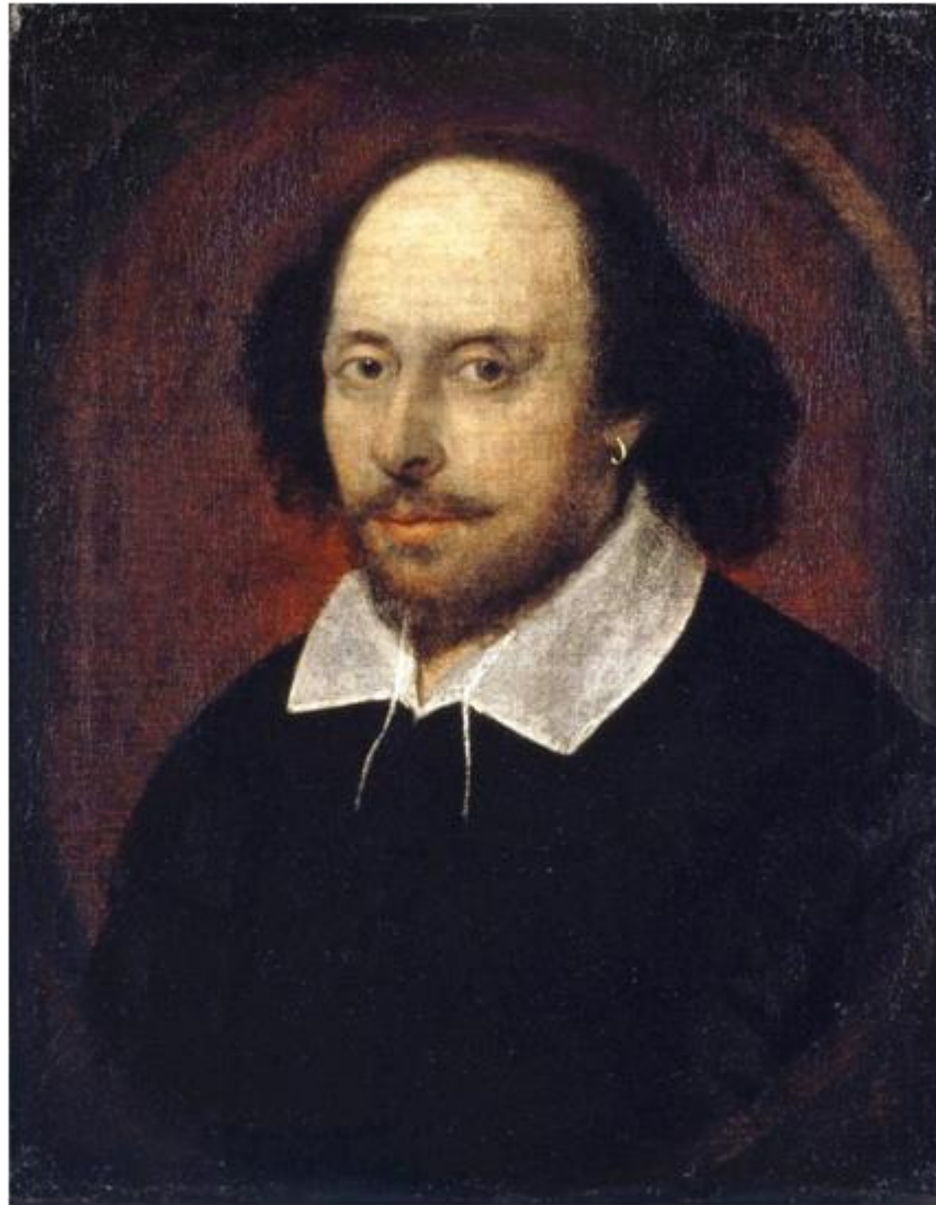
Уильям Шекспир (1564 – 1616 гг.)