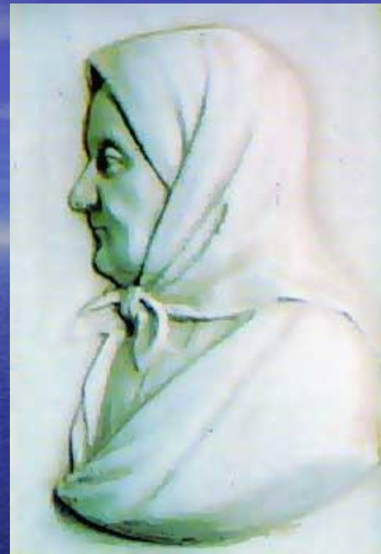
Яковлева Арина Родионовна