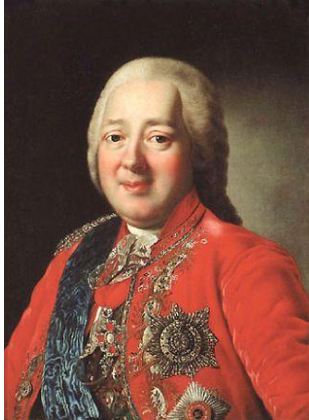
Никита Иванович Панин (18 сентября 1718 — 31 марта 1783) — русский дипломат и государственный деятель, граф, наставник великого князя Павла Петровича с 1760 года.