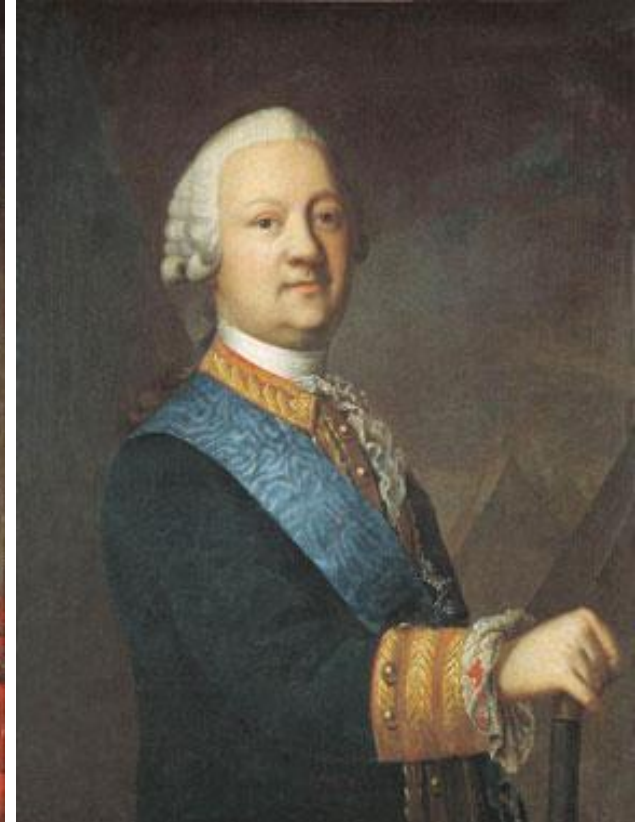
Петр Иванович Панин его брат граф , генерал-аншеф, герой Семилетней войны;