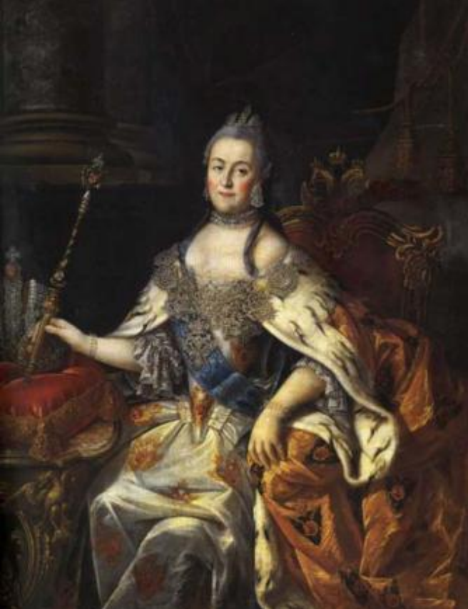
3. Екатерина II. (София Фредерика Августа Ангальт-Цербстская)