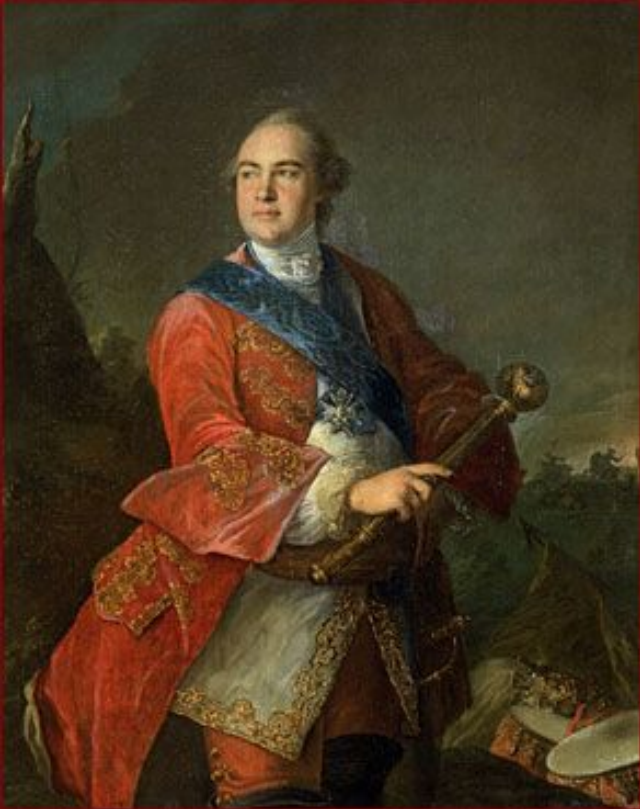
граф Кирилл Разумовский, маршал, командир Измайловского полка, гетман Украины, президент Академии наук