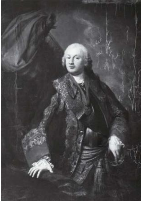
князь Михаил Волконский, дипломат и полководец Семилетней войны;