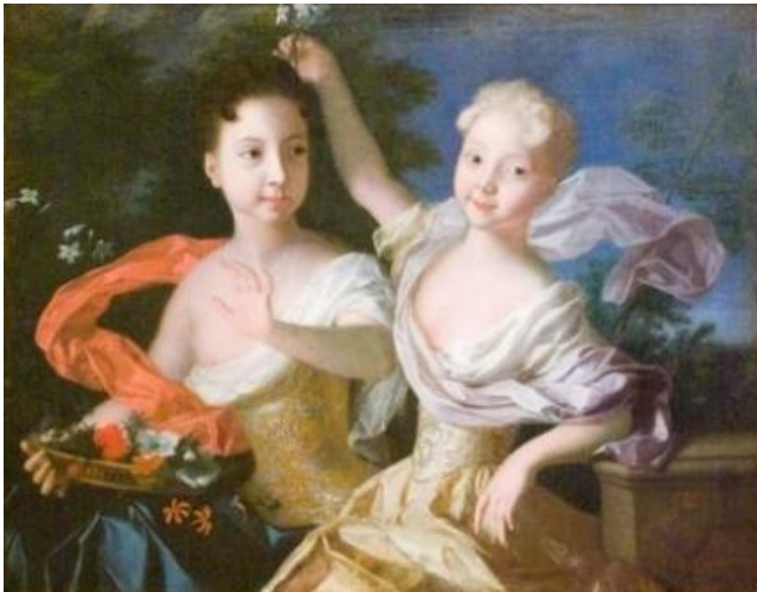
Анна Петровна и Елизавета Петровна

Еще в детстве принц Карл Петер Ульрих Голштейн-Готторпский (так звали Петра III) был объявлен наследником шведского престола.