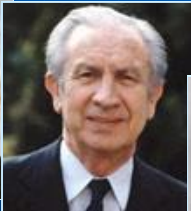
Хуан Антонио Самаранч