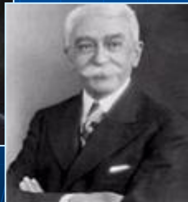
Пьер де Кубертен