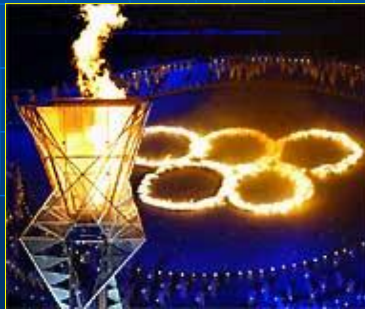
Афины, 2004 год

Ритуал зажжения священного огня происходит от древних греков и был возобновлен Кубертенем в 1912 году. Факел зажигают в Олимпии направленным пучком солнечных лучей, образованных вогнутым зеркалом. Олимпийский огонь символизирует чистоту, попытку совершенствования и борьбу за победу, а также мир и дружбу. Традиция зажигать огонь на стадионах была начата в 1928 году (на зимних Играх – в 1952 году). Эстафета по доставке факела в город-хозяин Игр впервые состоялась в 1936 году.