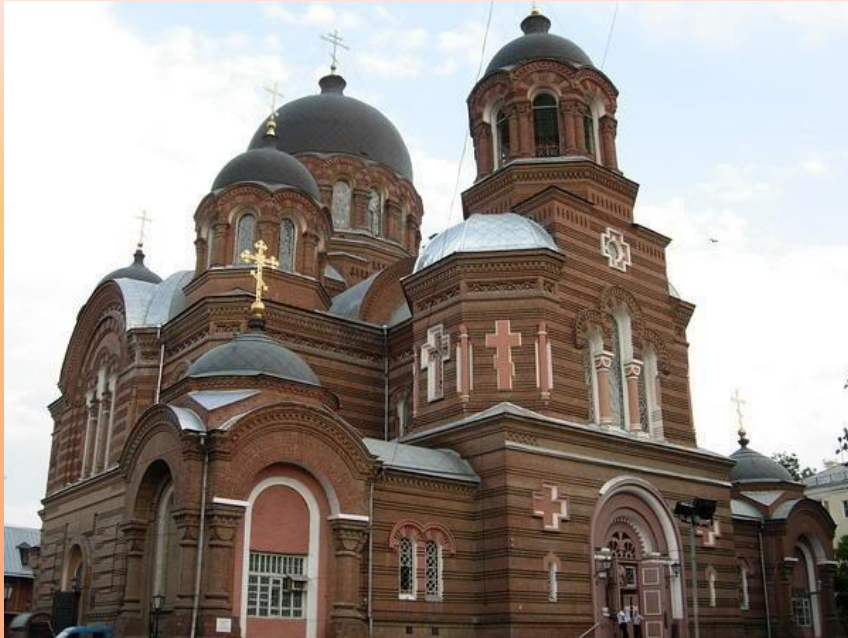
Свято-Екатерининский кафедральный собор

Митрополит Екатеринодарский и Кубанский Исидор