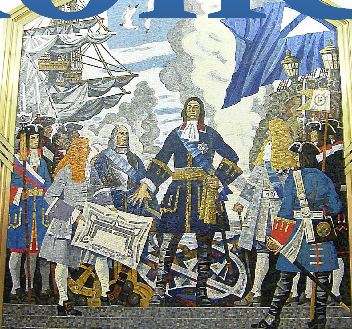
ОСНОВАНИЕ АДМИРАЛТЕЙСТВА В 1704 ГОДУ.