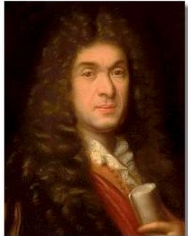
Роберт де-Визе (1650-1723)