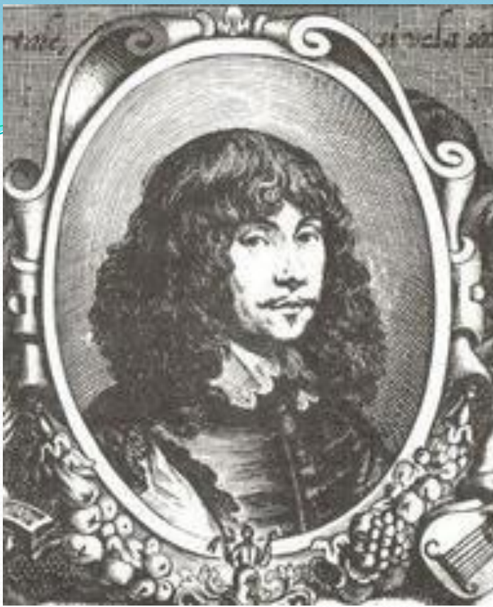
Франческо Корбетту (1620-1681)

пятиструнная гитара стала сольным музыкальным инструментом и приобрела широкую популярность благодаря таким гитаристам, как: