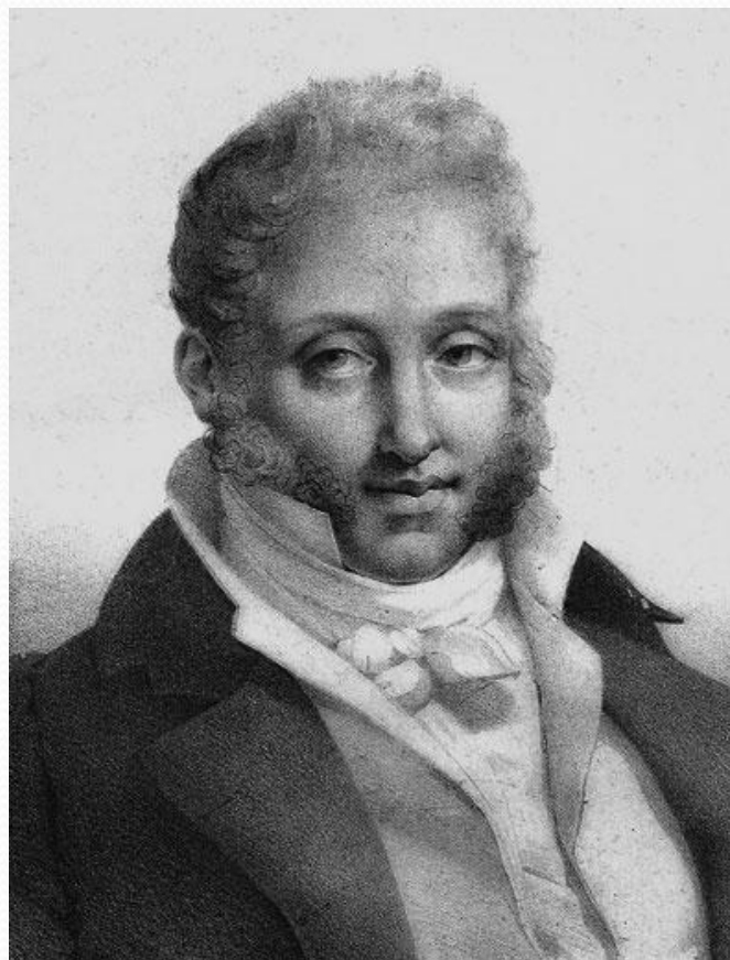
Фердинанд Карулли (1770-1841)