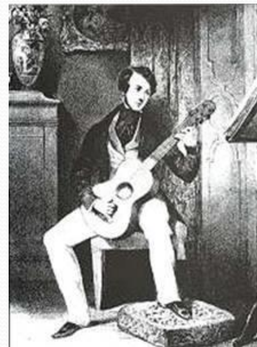
Маттео Каркасси (1792-1853)