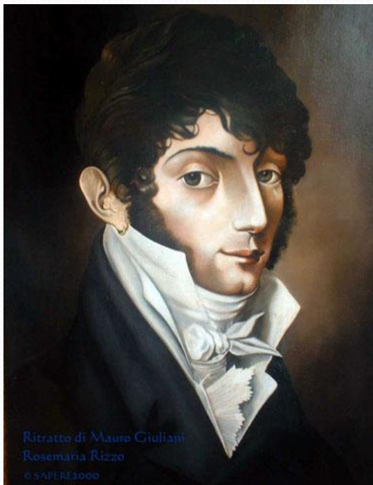
Мауро Джулиани (1781-1829)