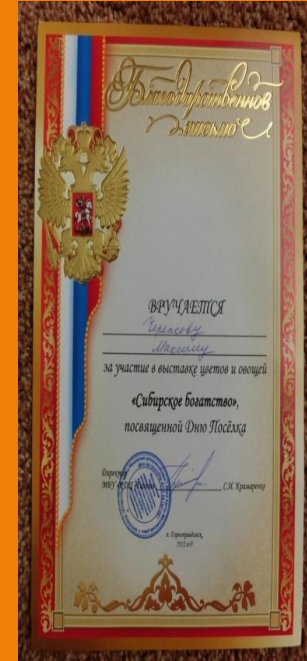
Выставка в ДК «Сибирское богатство»