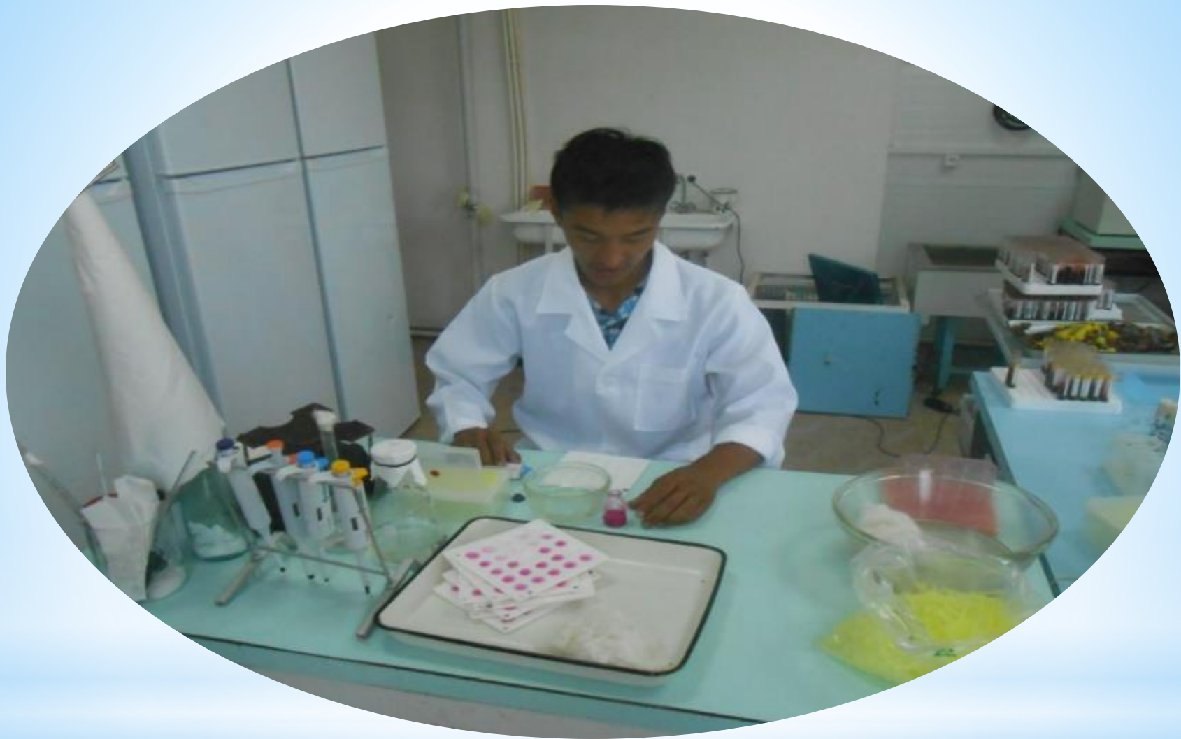
Тасқала аудандық ветеринариялық зерханасына биотехнология мамандығы бойынша жолданған жас маман