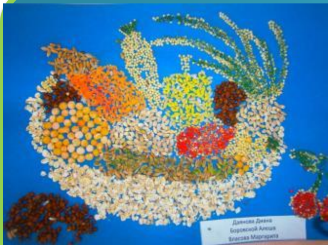
Дачная Дачка Боржской Аллея Владисла Маргарита