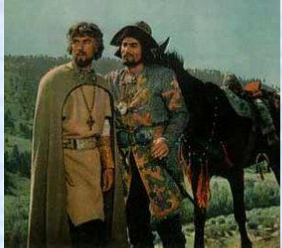
Кадр из фильма «Князь Игорь»

«Князь Игорь» — народно-эпическая опера. Сам композитор указывал на ее близость к глинкинскому «Руслану». Эпический склад «Игоря» проявляется в богатырских музыкальных образах, в масштабности форм, в неторопливом, как в былинах, течении действия.