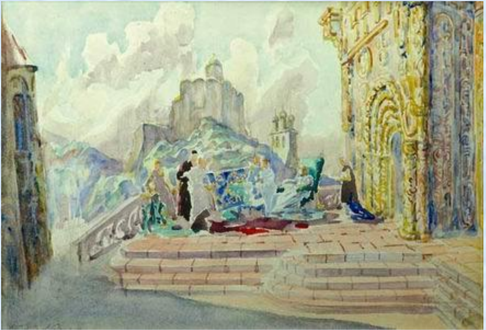
П.П. Соколов-Скаля. Эскиз декораций к опере "Князь Игорь»