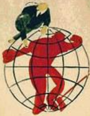
1. ПРОФ. СОЮЗЫ ВО ВСЕМ МИРЕ