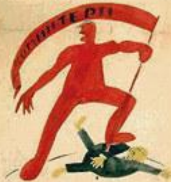
4. ПРОФСОЮЗЫ ПОБЕДИЛИ КАПИТАЛИЗМ И СОЗДАЛИ ТОВАРИЩЕСКИЙ СТРОИТЕЛЬСТВО