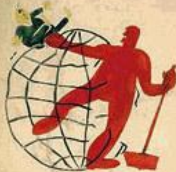
2. ПРОФСОЮЗЫ ПОБЕДИЛИ КАПИТАЛИЗМ