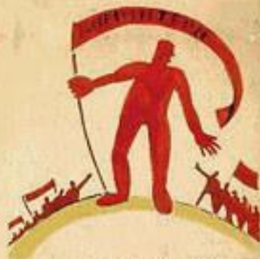
3. ПРОФСОЮЗЫ ПОБЕДИЛИ КАПИТАЛИЗМ И СОЗДАЛИ ТОВАРИЩЕСКИЙ СТРОИТЕЛЬСТВО