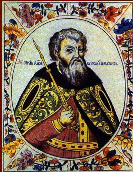
Всеволод III Юрьевич Большое гнездо