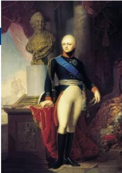
Император Александр I (Россия)

Отечественная война 1812 года— война между Россией и наполеоновской Францией на территории России в 1812 году. Причинами войны стали отказ России активно поддерживать континентальную блокаду, в которой Наполеон видел главное оружие против Англии, а также политика Наполеона в отношении европейских государств.