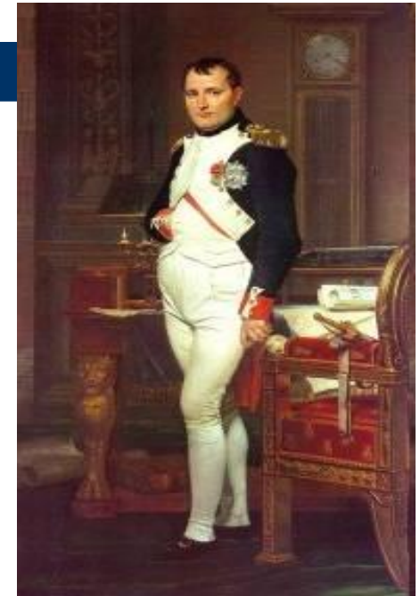
Наполеон Бонапарт (Франция)

Отечественная война 1812 года— война между Россией и наполеоновской Францией на территории России в 1812 году. Причинами войны стали отказ России активно поддерживать континентальную блокаду, в которой Наполеон видел главное оружие против Англии, а также политика Наполеона в отношении европейских государств.