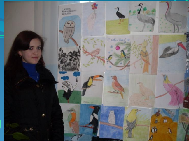
Трясогузка - птица года 2011

Основной формой работы являются практические занятия в природе, проводим такие компания: День журавля, Международные Дни наблюдения птиц, Международный День птиц, Весна идет, Птица года.