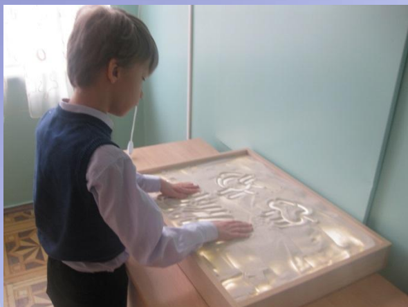
Стол для рисования песком