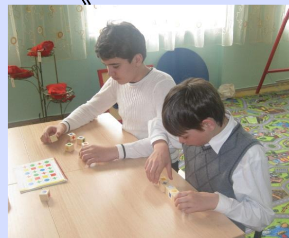
«Кубики Никитина «Логические»