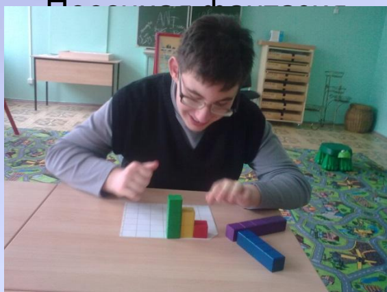
Кубики Никитина «Кубики для всех»