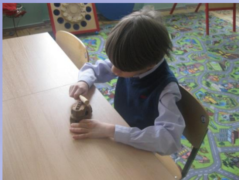
Музыкальный инструмент «Лягушка»