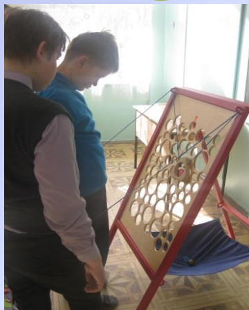
«Сырный ломтик» (напольный)