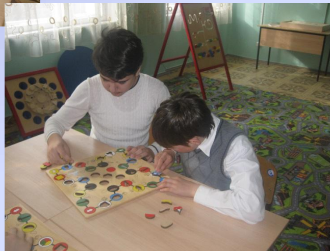
«Найди фигурке место»