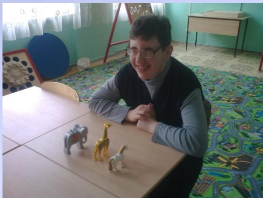
Игры на развитие зрительной памяти