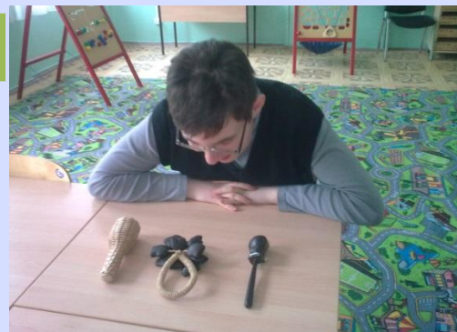
«Развитие слуховой памяти»