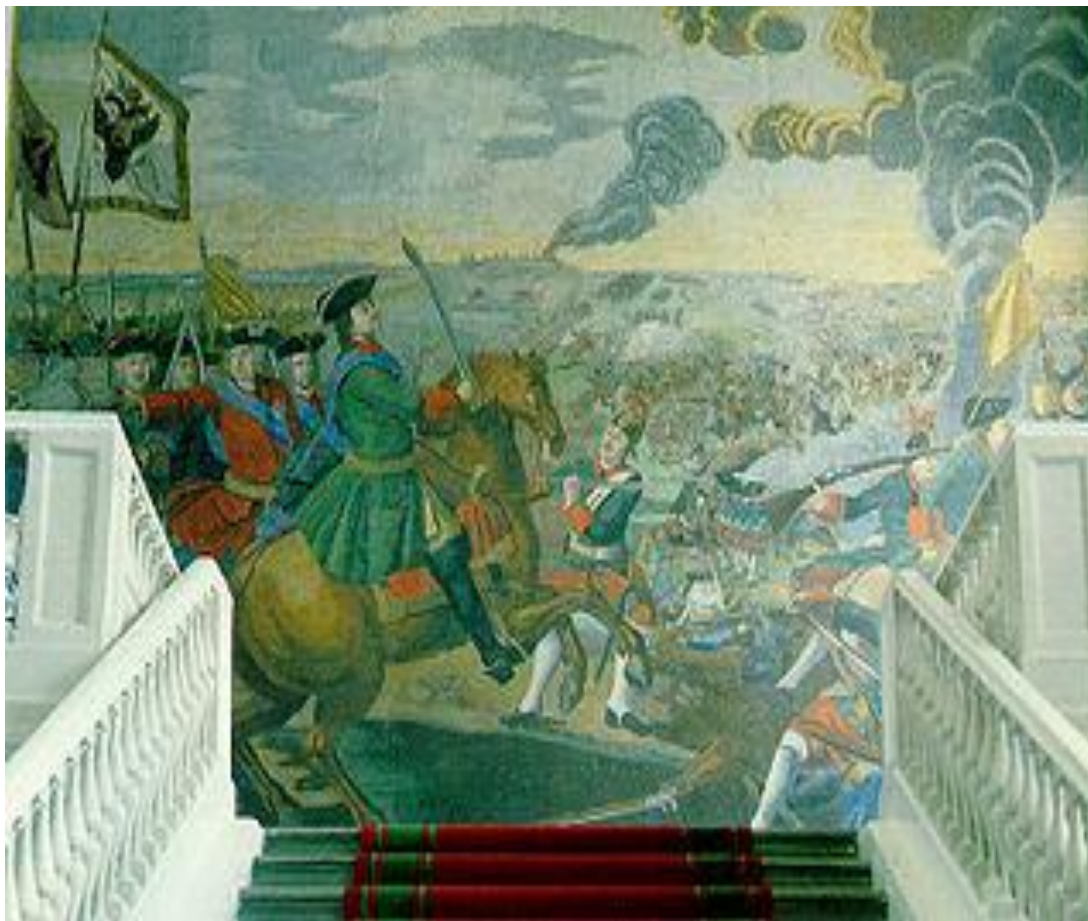
«Полтавская баталия». Мозаика М. В. Ломоносова в здании Академии Наук. Санкт-Петербург. 1762—1764