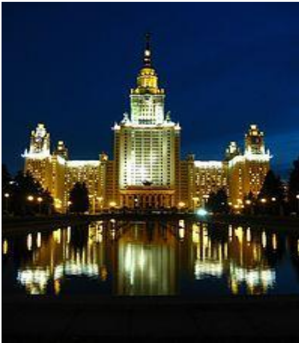
Московский Государственный университет имени Ломоносова М.В.