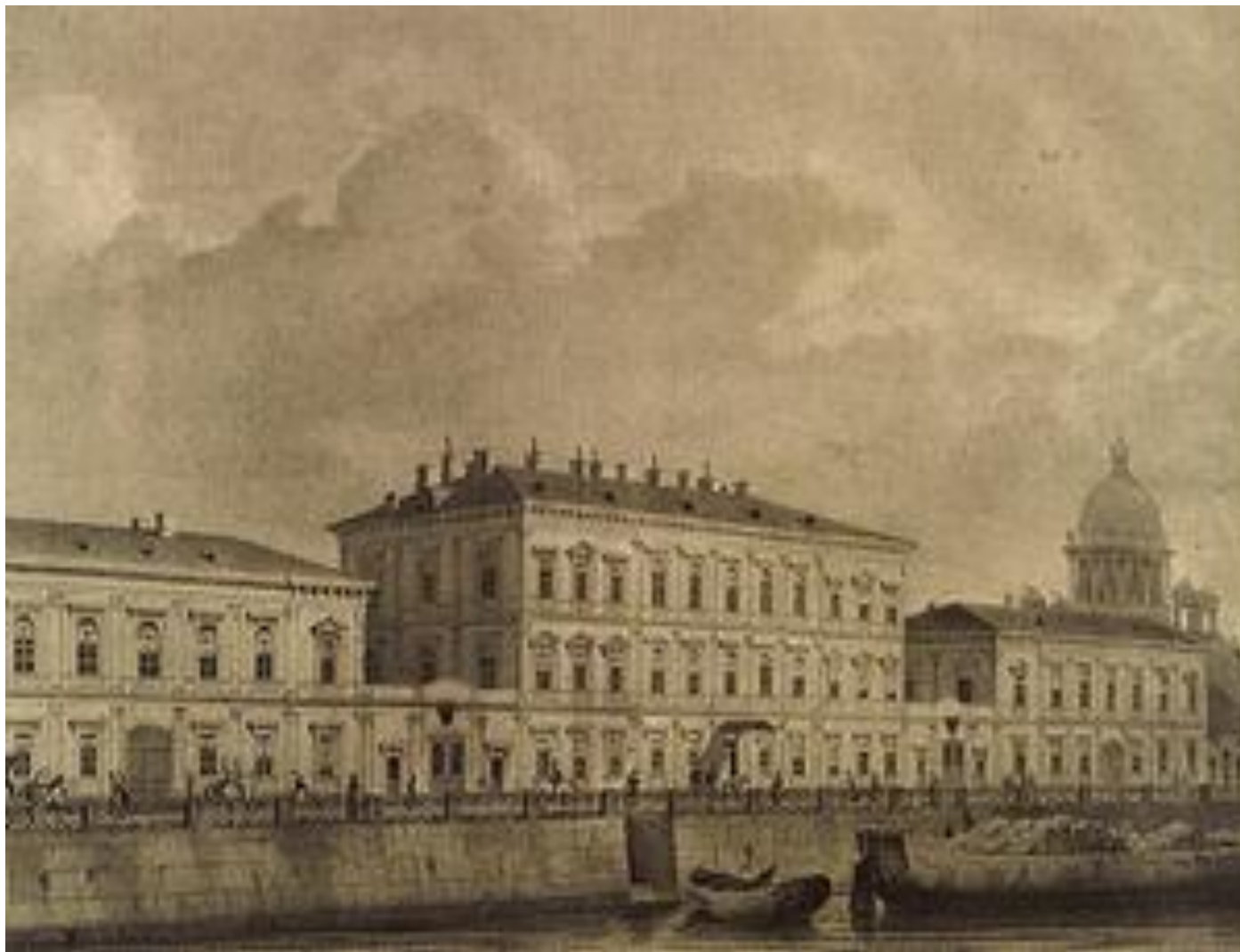
Дом М. В. Ломоносова на Мойке