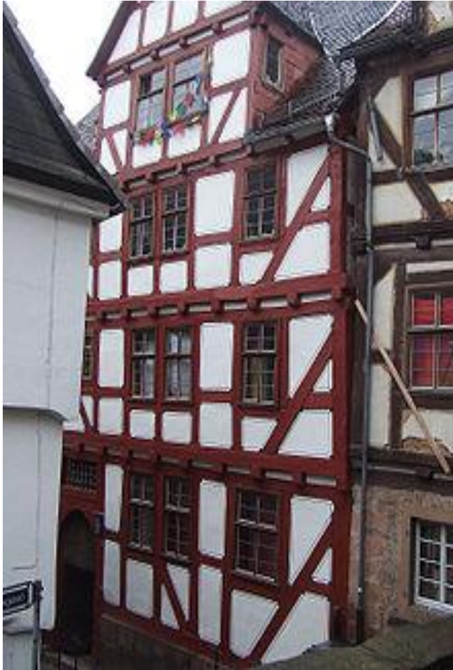
Дом, в котором жил Ломоносов в Марбурге

Изучение естественных наук Ломоносов успешно сочетал с литературными занятиями. В Марбурге он познакомился с новейшей немецкой литературой. Ломоносов занимался с увлечением не только теоретическим изучением западноевропейской литературы, но практической работой