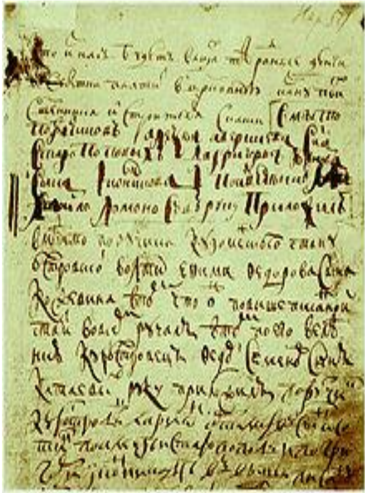
Юношеский почерк Ломоносова.