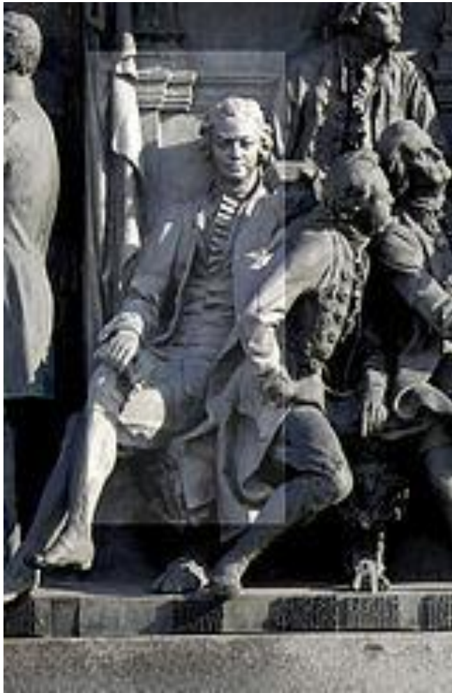
Памятник М.В. Ломоносову в Великом Новгороде.

«Ломоносов был великий человек. Между Петром I и Екатериною II он один является самобытным сподвижником просвещения....».