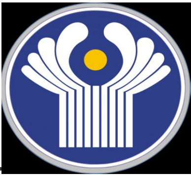
СНГ в борьбе с терроризмом