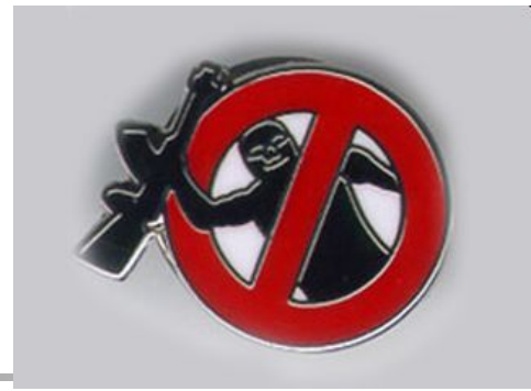
Эмблема ЦРУ по борьбе с терроризмом