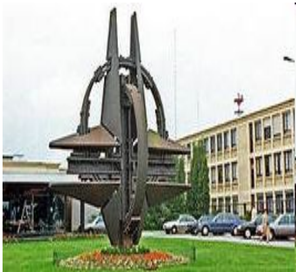
Штаб-квартира НАТО в Брюсселе (Бельгия)