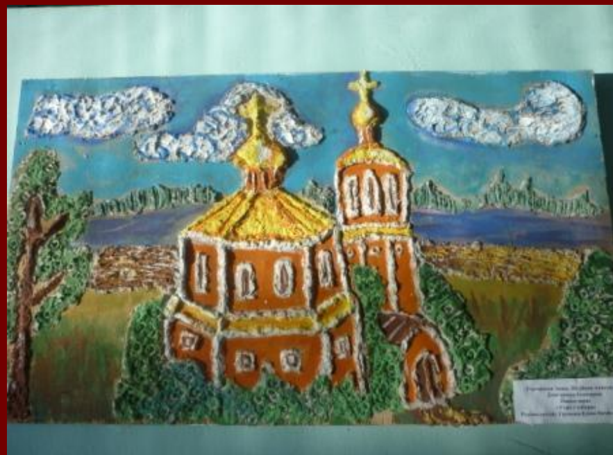
Панно «Утро у собора»