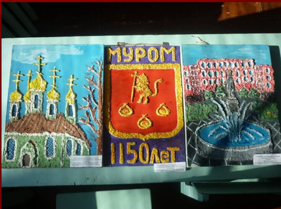
Триптих «Юбилей города»