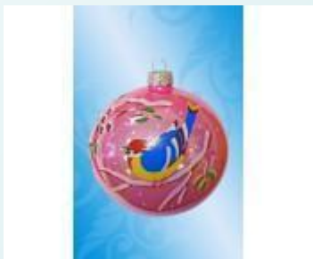
Предметы из стекла