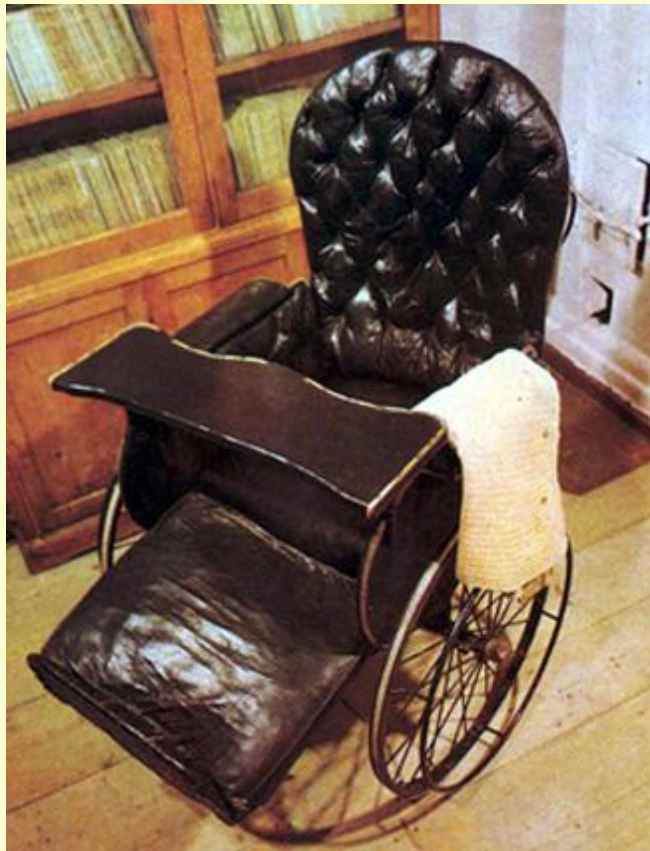
Кресло Л.Н. Толстого