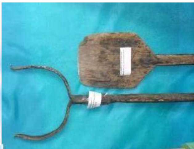
Лопата для печи, ухват