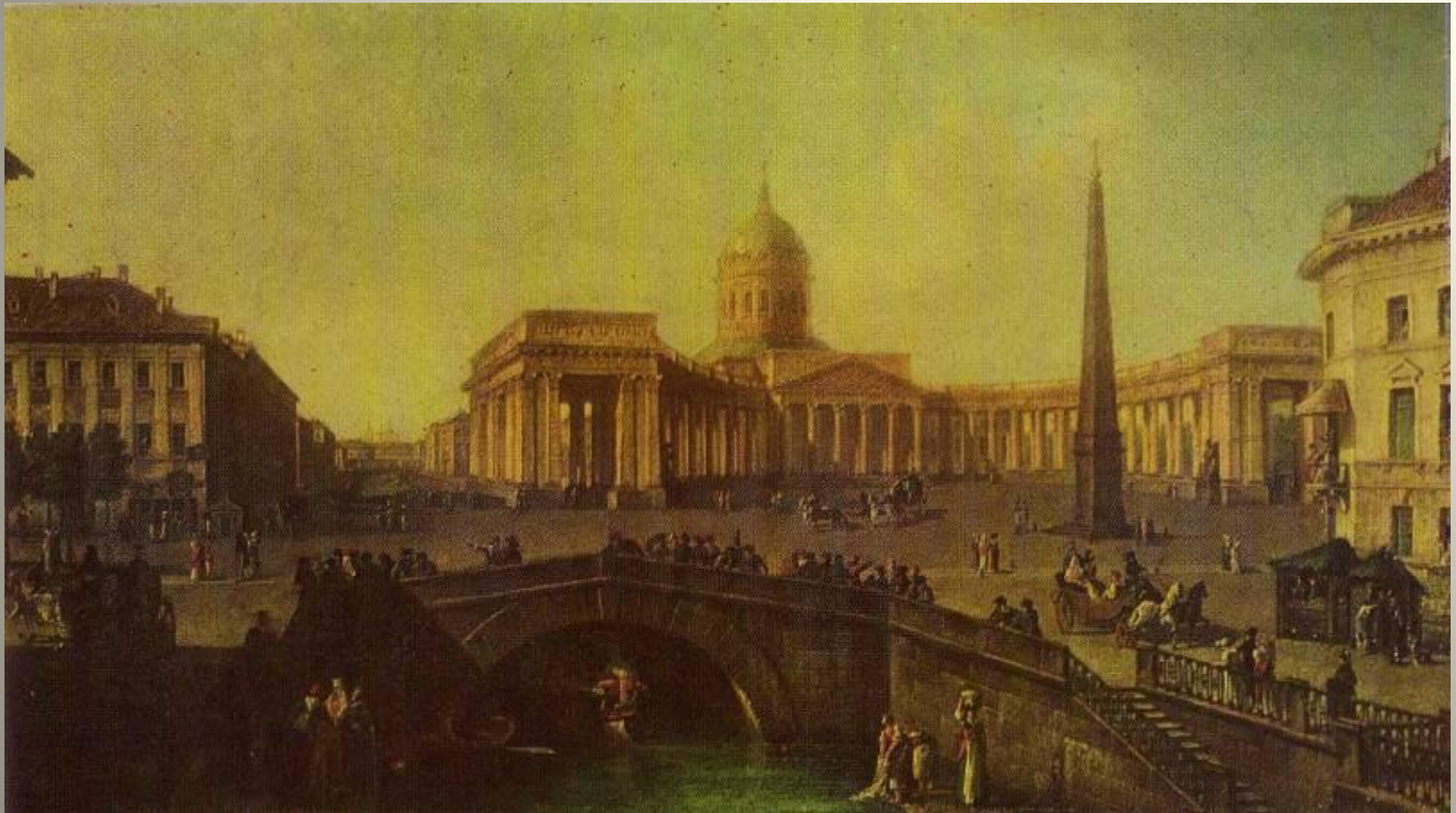
Вид Казанского собора в Петербурге. Картина Ф. Я. Алексеева. 1810-е гг.

В Петербурге было лишь два места, которые в равной мере посещали представители всех сословий. Это церковь и театр.