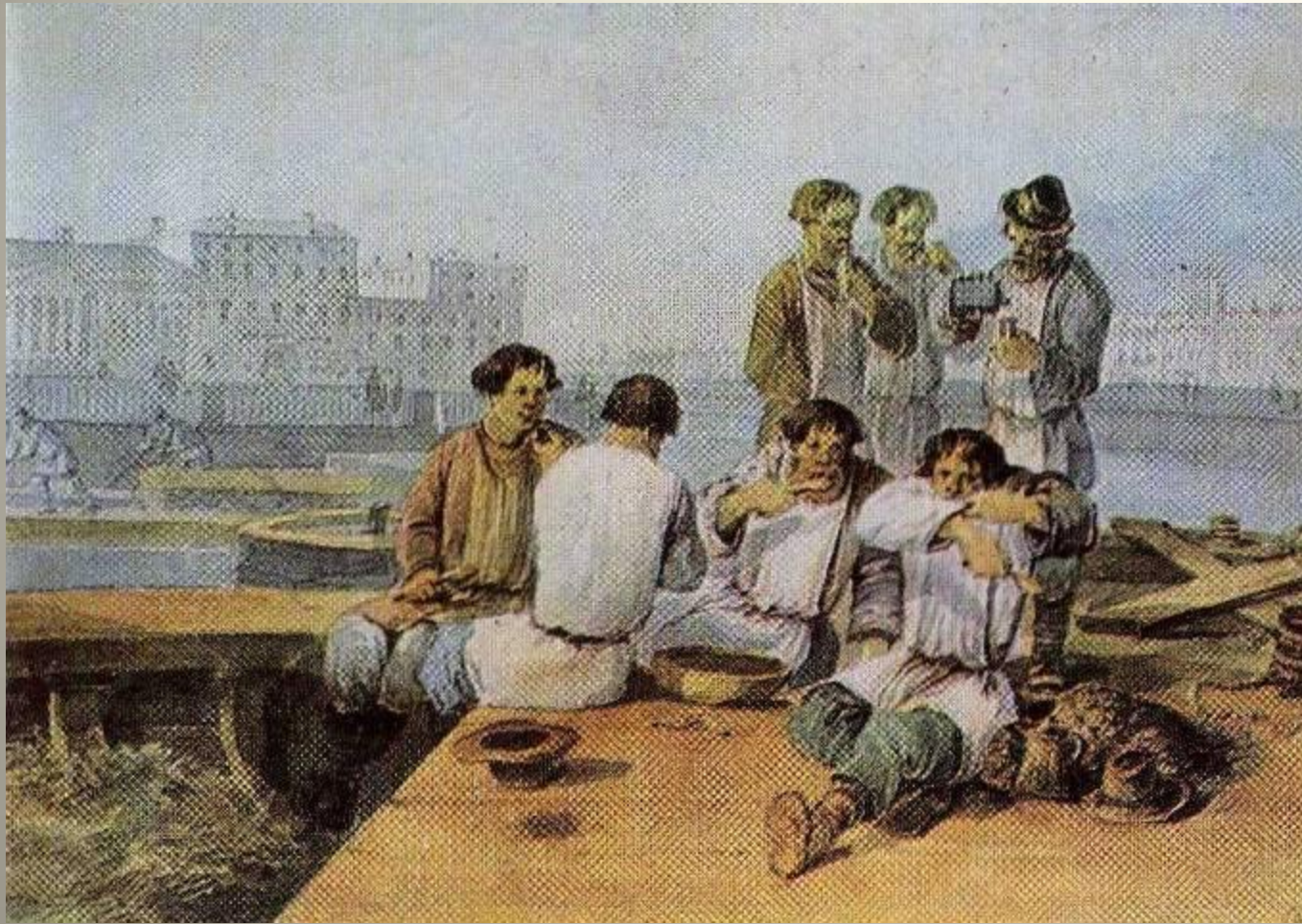
На Неве. Обед грузчиков. Акварель К. И. Кольмана. 1820-е гг.

Между тем простой народ на улицах жил. В большинстве своём это были “лица крестьянского звания”, приехавшие в город на заработки. Часто они ночевали, и обедали, и развлекались, и вели беседы с приятелями, и работали на улице.