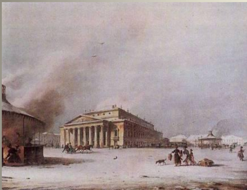
Петербургский Большой Театр. Раскрашенная литография К. П. Беггрова.