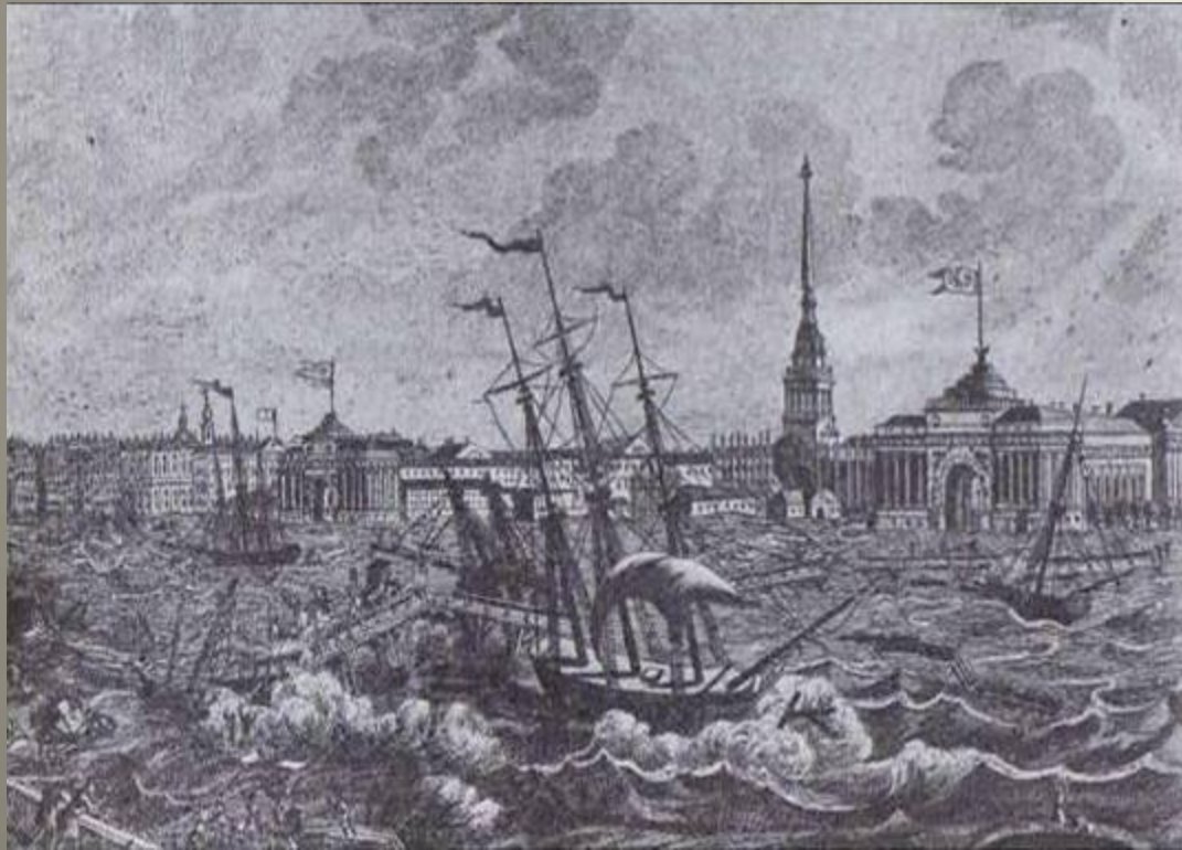
Петербургское наводнение 7 ноября 1824 года. Гравюра 1820-е гг.

Наводнение, случившееся в Петербурге 7 ноября 1824 года, осталось памятным для последующих поколений не только потому, что было самым мощным и разрушительным в истории города, но и потому, что попало в пушкинскую поэму “Медный всадник”.