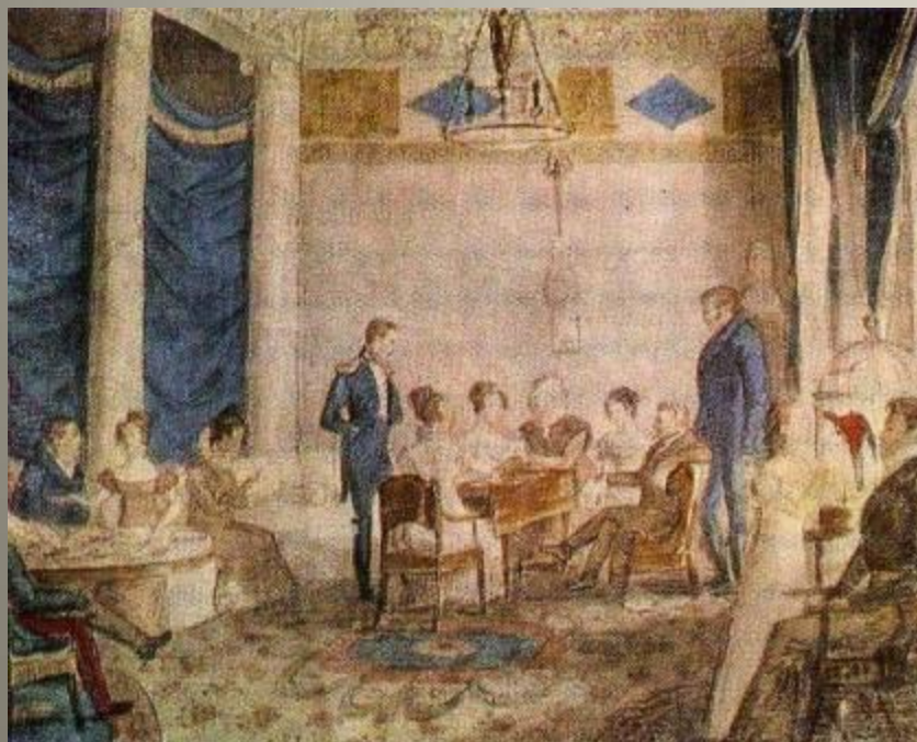
В гостиной Олениных. Акварель неизв. Художника. 1820-е гг.