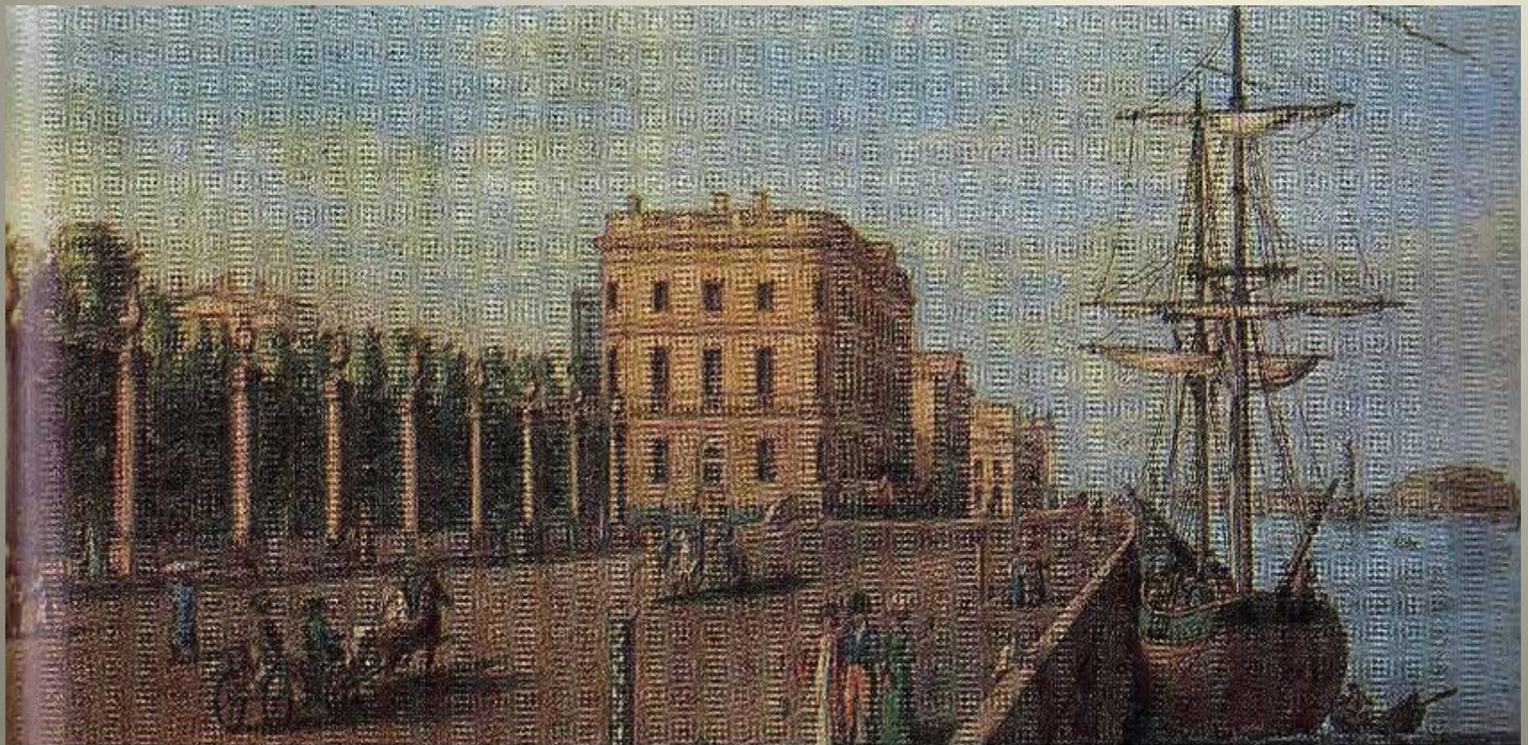
Набережная Невы у Летнего сада. Раскрашенная литография. 1820-е гг.

С Пушкиным вошёл в отечественную литературу и новый герой, сразу ставший одним из самых значительных её героев, - город Петербург, город с императорским двором, парадами, чиновными особами и обывателями.