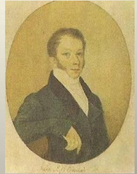
В. Ф. Одоевский В.А. Тропинин. 1831

Пушкин и литераторы его круга постоянно собирались у А.Н. Оленина, А.А.Дельвига, П.А. Плетнева, В.А.Жуковского, В.Ф. Одоевского, Е.А.Карамзиной.