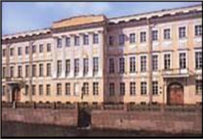
Набережная реки Мойки, 12. Дом, где была последняя квартира А.С. Пушкина