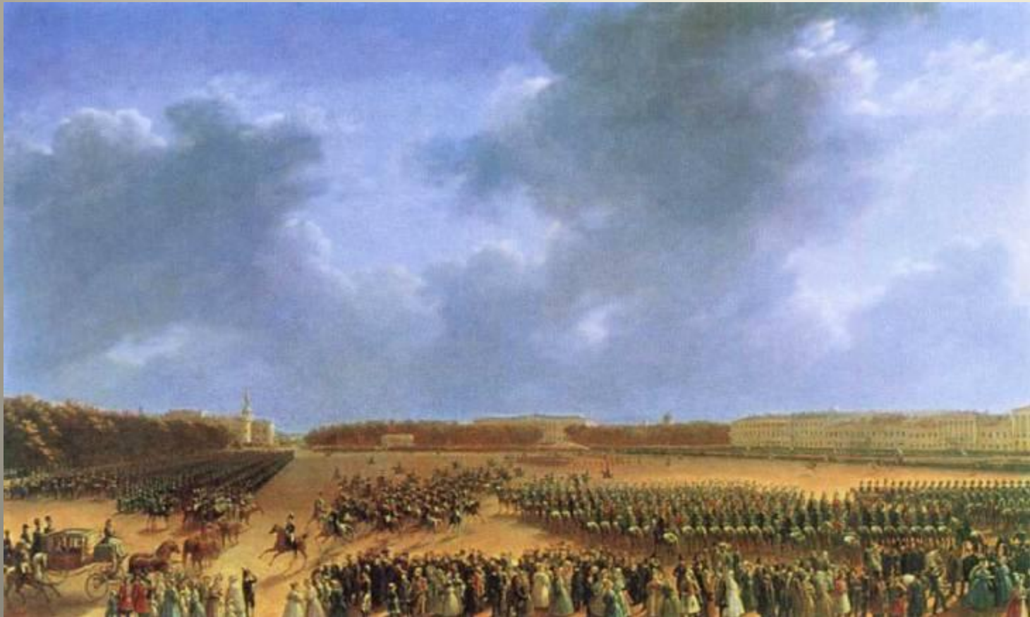
Парад на Царицыном лугу в 1831 году. Картина Г.Г. Чернецова. 1831-1837 гг.

Парады и смотры императорской гвардии были зрелищем впечатляющим. Парады устраивались лишь в торжественных случаях – в день рождения императрицы, на крещение, в годовщину вступления российских войск в Париж, по случаю приезда иностранных монархов. Смотры проводились регулярно.