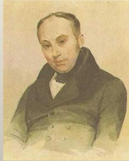
В. А. Жуковский П.Ф.Соколов с оригинала К.П. Брюллова. 1837