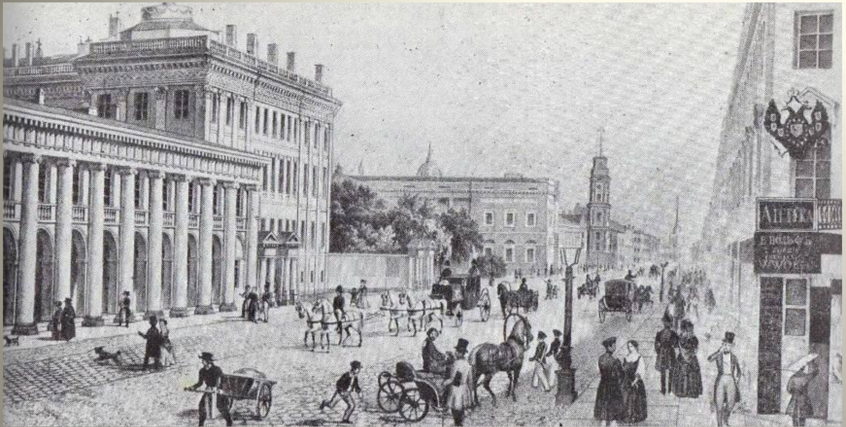
Невский проспект. Вид от Аничкова моста. Литография. 1830-е гг.