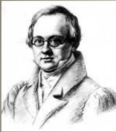
А. А. Дельви́г В.П. Лангер. 1830г.