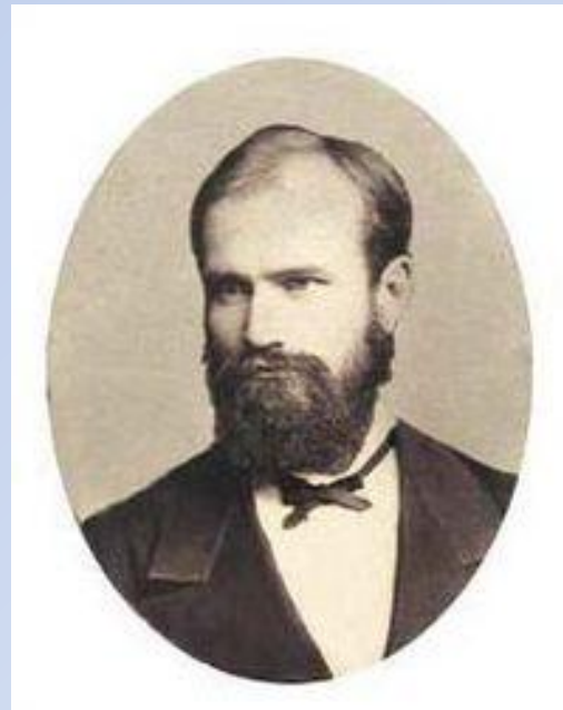
Бодуэн де Куртенэ И.