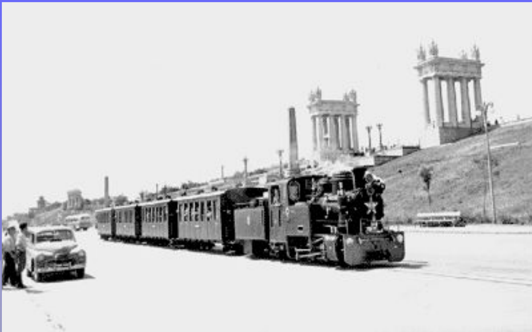
Набережная Сталинграда с Детской Железной Дорогой