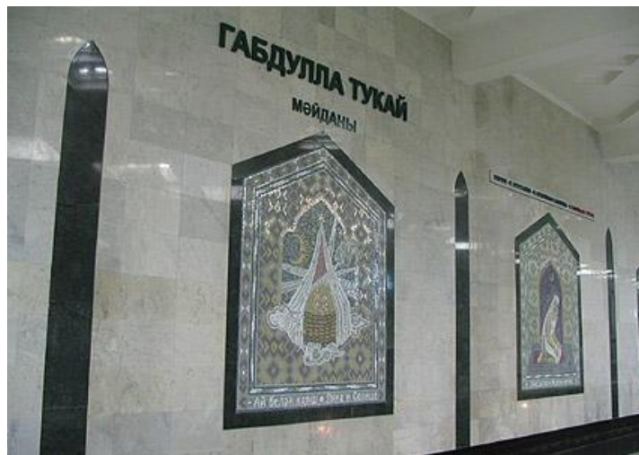
Казан шәһәренең Габдулла Тукай мөйданы.