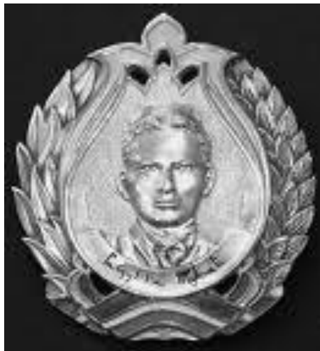
Габдулла Тукай исмендәге Татарстан Дәүләт премиясе.

Габдулла Тукай истәлегенә күп әдәби һәм мәдәни чаралар, оешмалар аның исемен йөртә. Шуларның арасында: