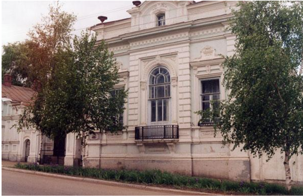
Музей уездного города