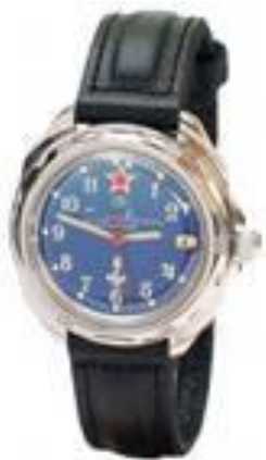
ОАО ЧЧЗ «Восток»