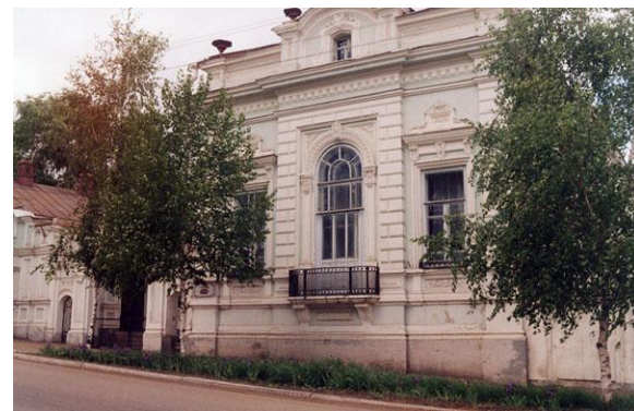
Музей уездного города