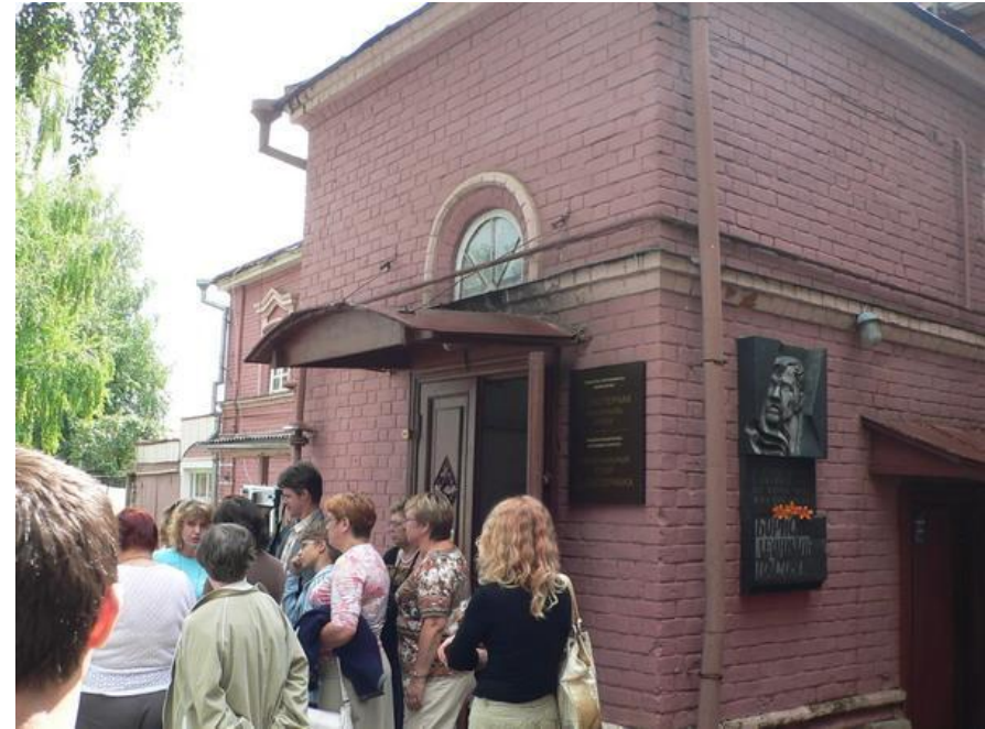
Дом-музей Бориса Пастернака