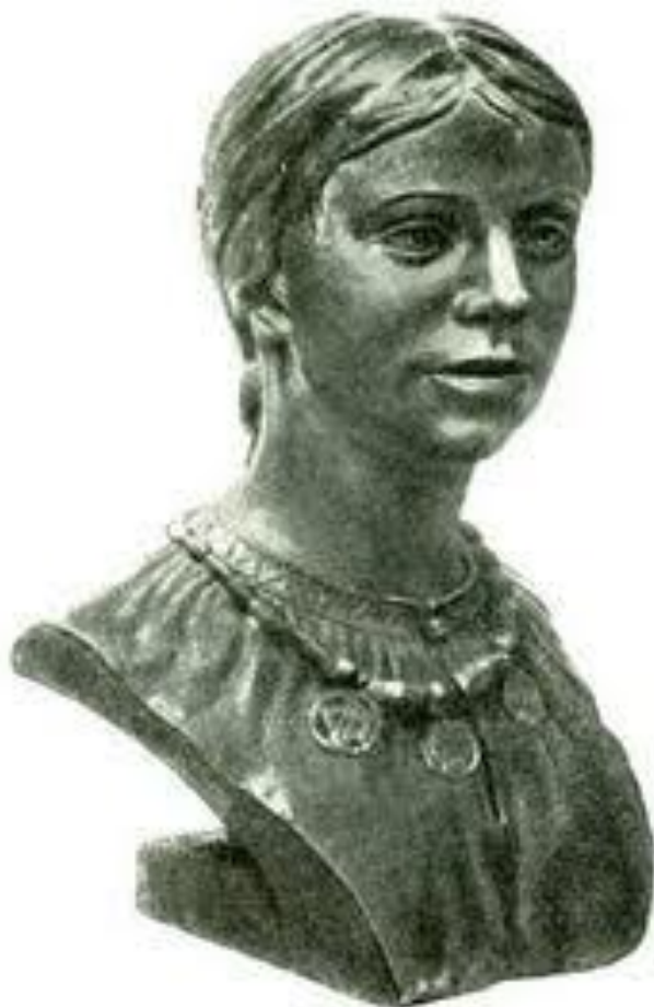
Женщина из племени вятичей