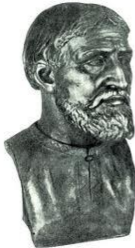
Мужчина из племени кривичей