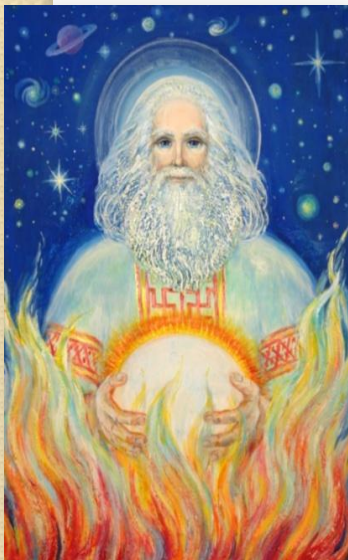
Сварог бог вселенной

Язычество – вера в существование многих богов и духов (многобожие)