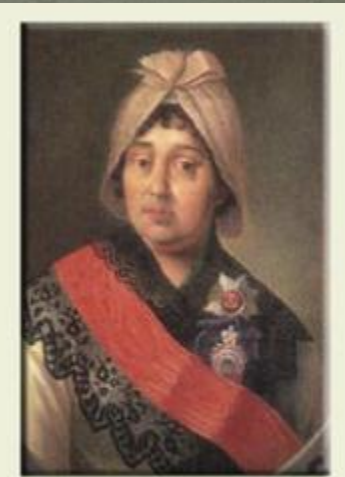
Варвара Ивановна Суворова (княжна Прозоровская) жена полководца