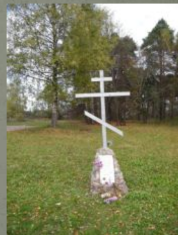
Памятный крест на месте усадьбы Суворова