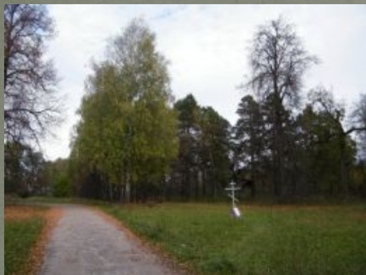
«Суворовская роща» г. Лакинск