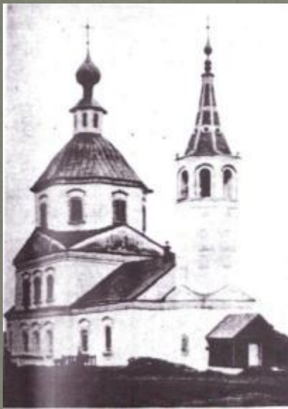
Рис. 31. Церковь с. Кистыш, Суздальского уезда.