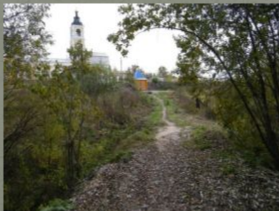
«Суворовская тропа» г. Лакинск