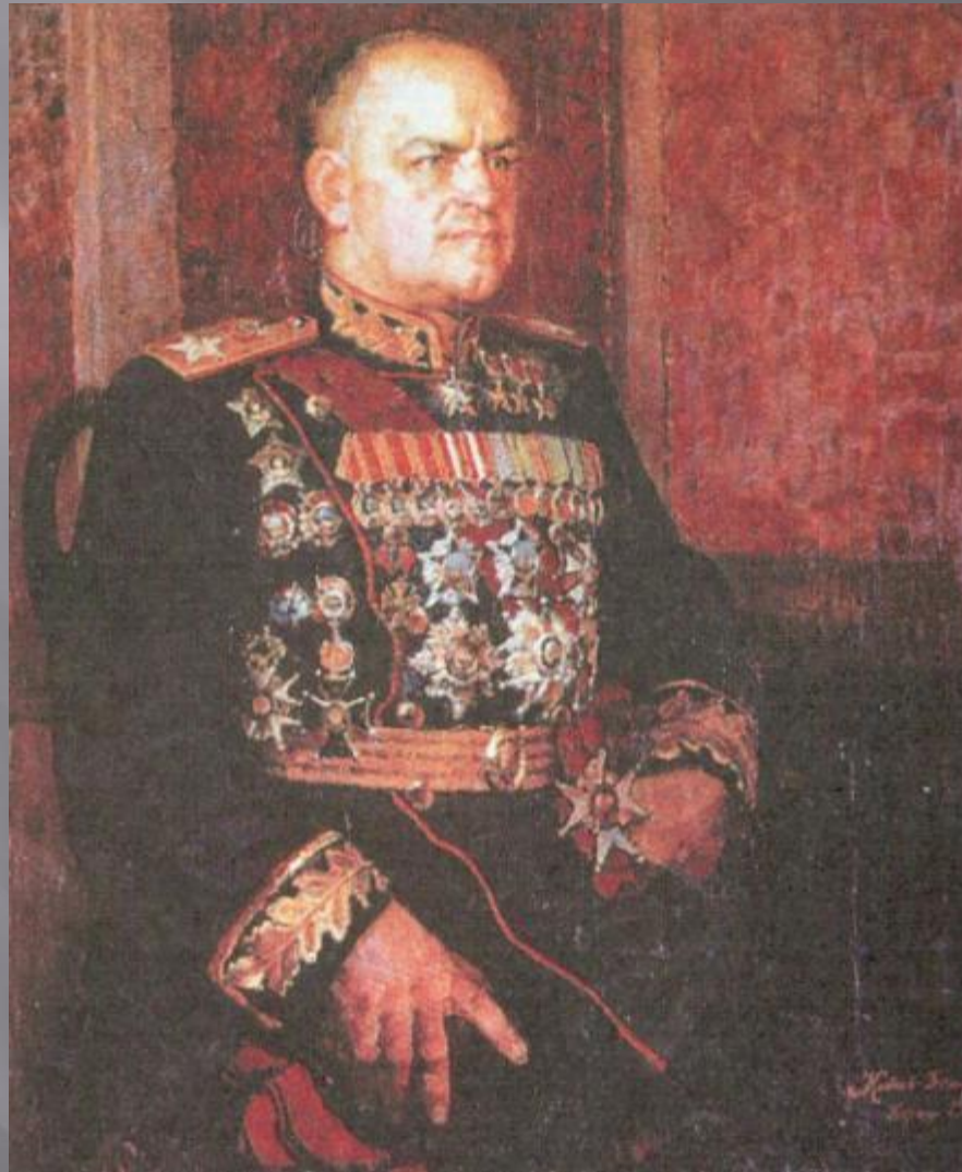
Жуков Георгий Константинович