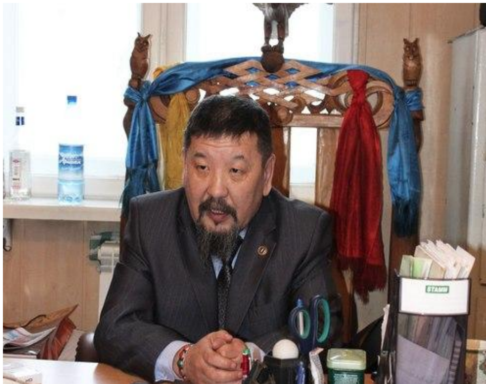
Верховный шаман Бурятии Баир Цырендоржыев