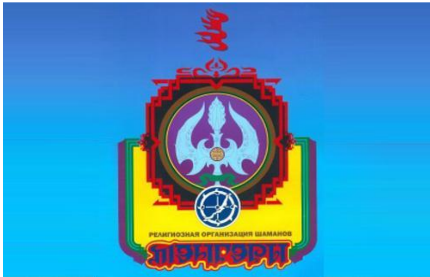
Религиозная организация шаманов «Тэнгэри» в Бурятии