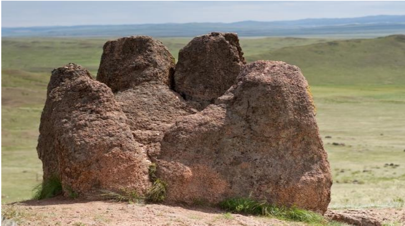
Табан хурган - пять пальцев. Республика Бурятия.