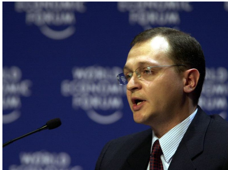
Сергей Владиленович Кириенко

17 августа 1998 г. – дефолт (прекращении выплат по ГКО)