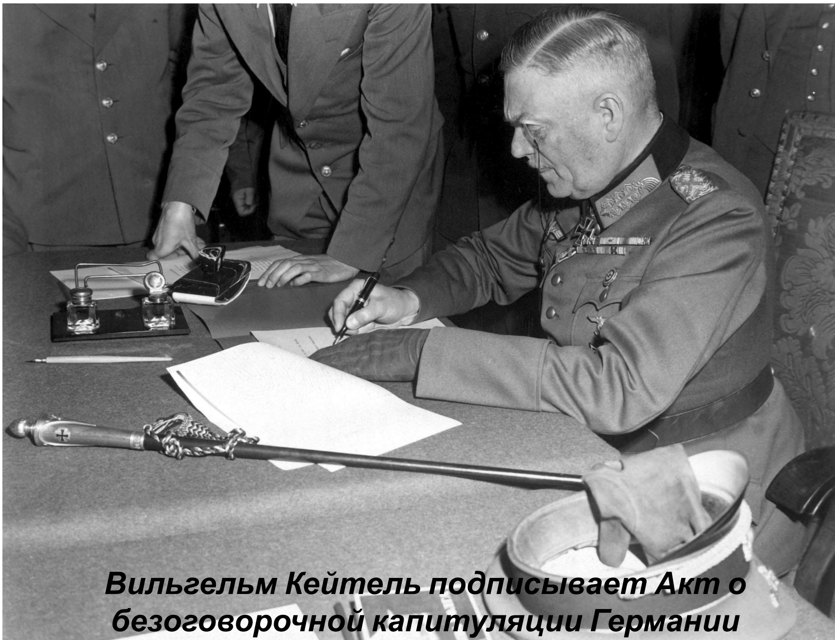
Вильгельм Кейтель подписывает Акт о безоговорочной капитуляции Германии