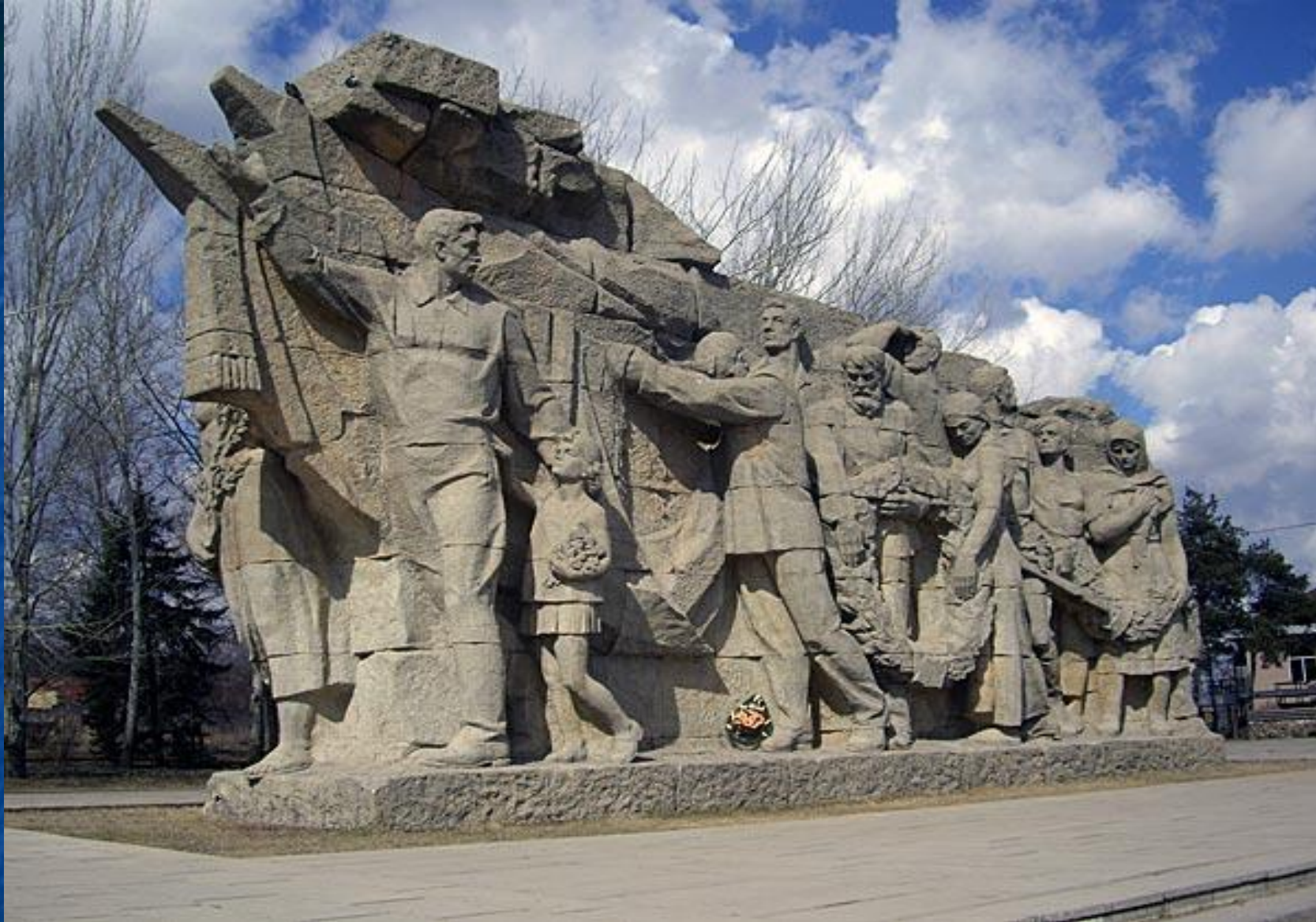
У ВХОДА НА МАМАЕВ КУРГАН. СКУЛЬПТУРА «ПАМЯТЬ ПОКОЛЕНИЙ».