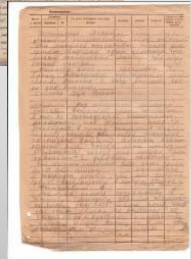
Амбарные книги с записями протоколов общего собрания членов колхоза «Мустай» Сернурского района и членов правления с января 1941 года по декабрь 1945 года.