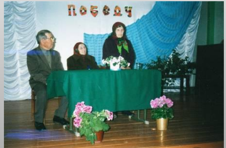
Встреча с тружениками тыла в Мустаевской школе . Фото 2010 г.