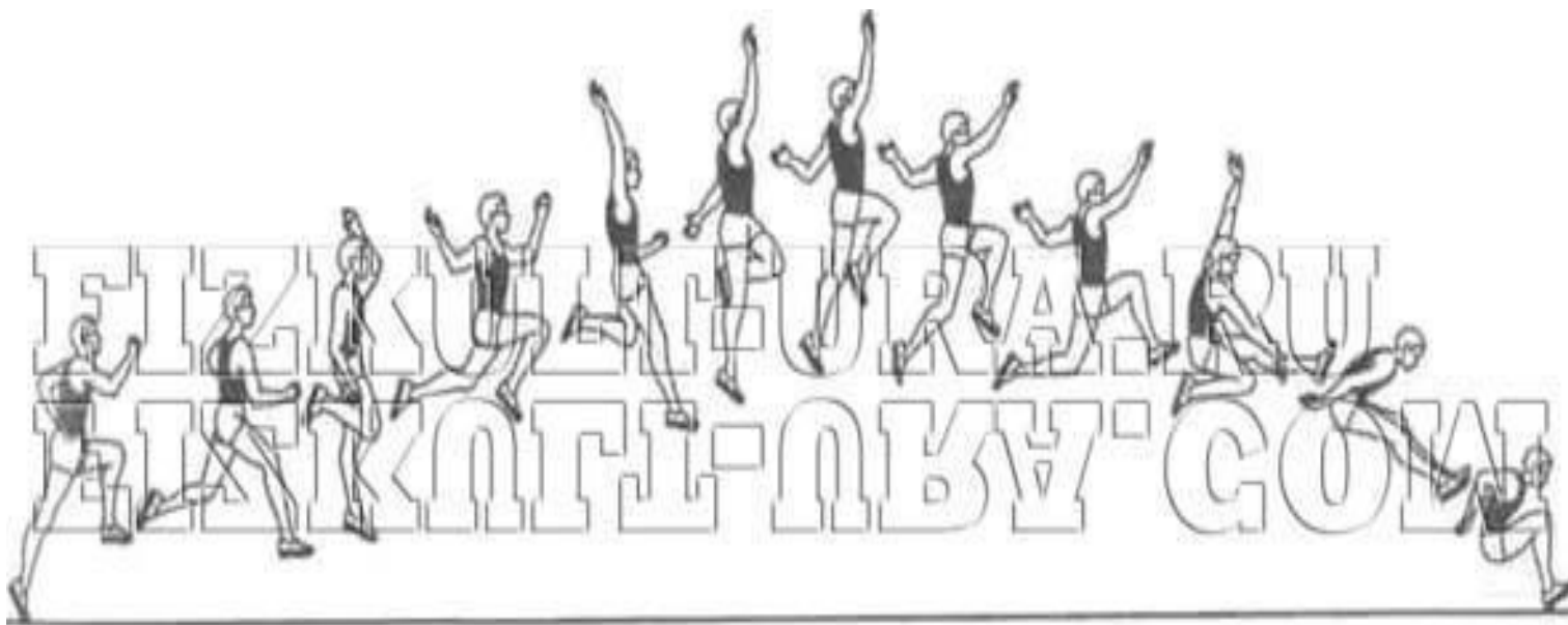
Прыжок в длину с разбега способом «ножницы»

НАИБОЛЕЕ РАЦИОНАЛЬНЫЙ СПОСОБ ПРЫЖКА - «НОЖНИЦЫ», ПОЗВОЛЯЕТ СПОРТСМЕНУ СОКРАТИТЬ ВРЕМЯ ПОДГОТОВКИ К ОТТАЛКИВАНИЮ И СОЗДАТЬ УСТОЙЧИВОЕ ПОЛОЖЕНИЕ ТЕЛА В ПОЛЕТЕ. ЭТОТ СПОСОБ ХАРАКТЕРИЗУЕТСЯ ВЫПОЛНЕНИЕМ ДВИЖЕНИЙ В ПОЛЕТНОЙ ФАЗЕ, БЛИЗКИХ К ДВИЖЕНИЯМ ПРИ БЕГЕ.