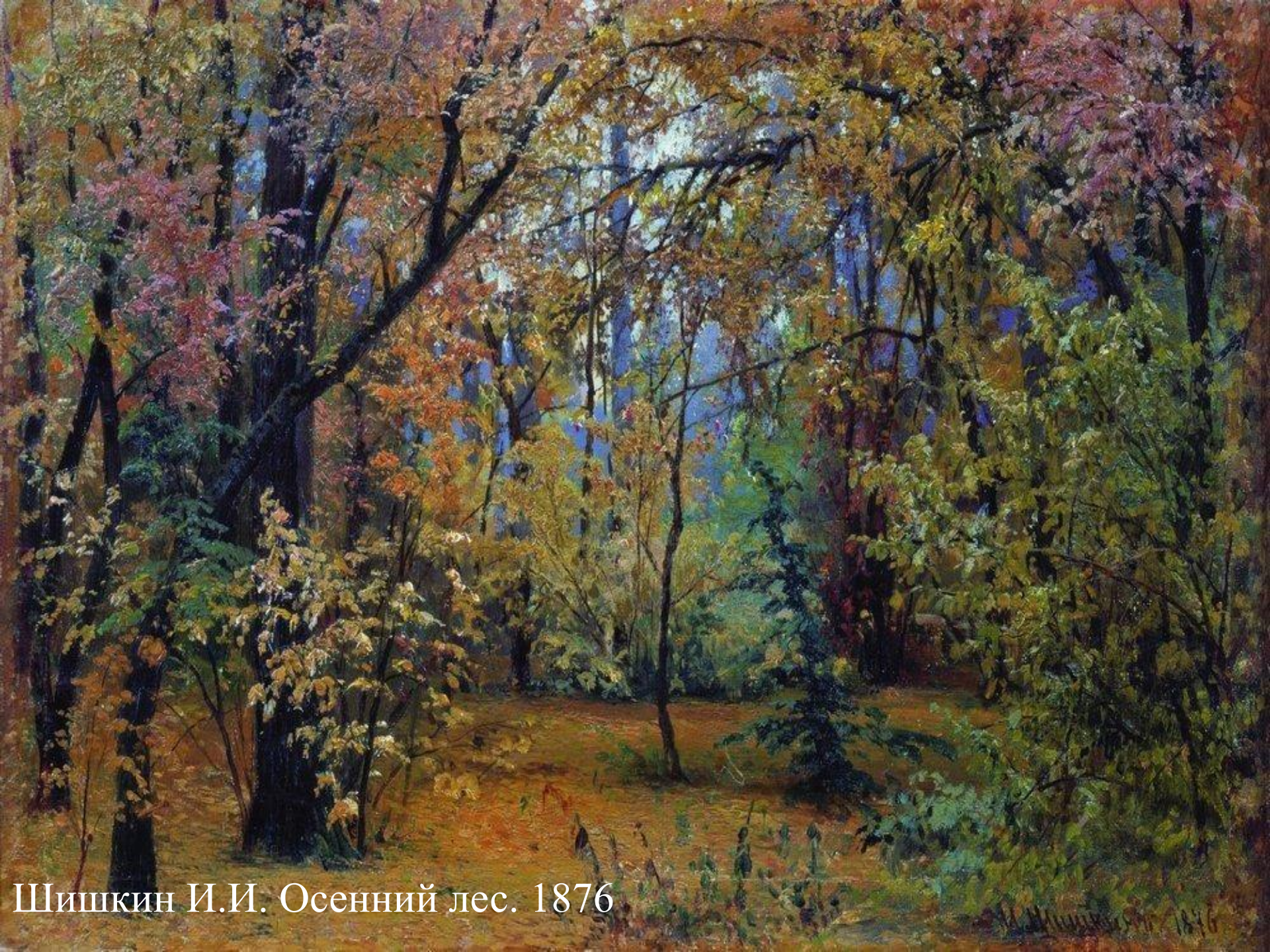
Шишкин И.И. Осенний лес. 1876