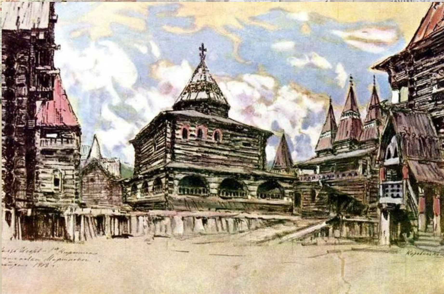
М. Врубель. Опера А. Бородина «Князь Игорь»