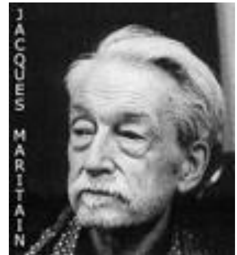
Жак Маритен (1882-1973)

Представители: Ж. Маритен, Э. Жильсон, Тейяр де Шарден