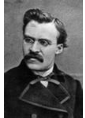
Ф. Ницше (1844-1900)

Центральное понятие – жизнь как интуитивно постигаемая целостная реальность, не тождественная ни духу, ни материи.