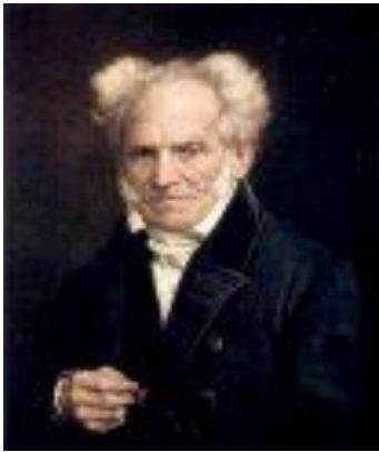
А. Шопенгауэр (1788-1860)