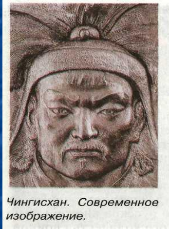
Чингисхан. Современное изображение.