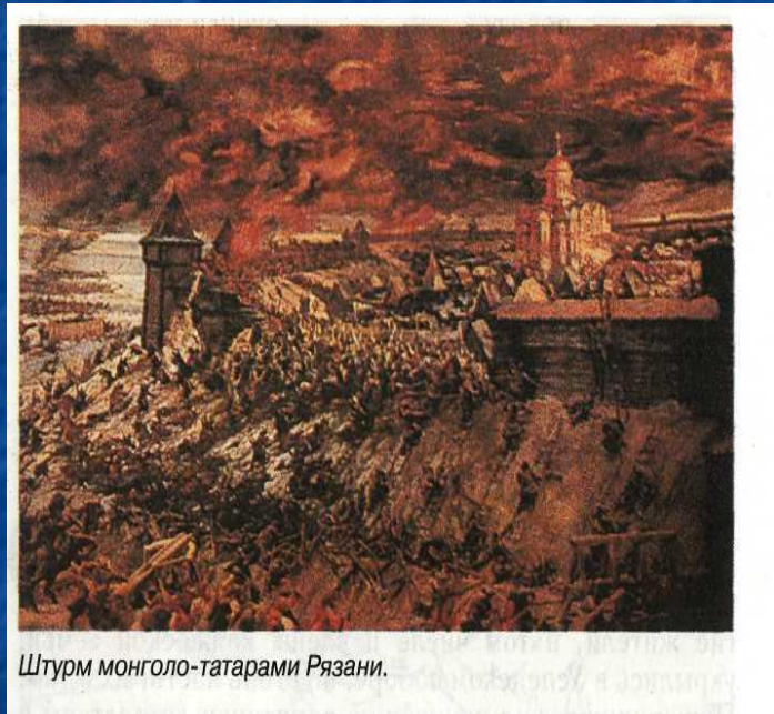
Штурм монголо-татарами Рязани.