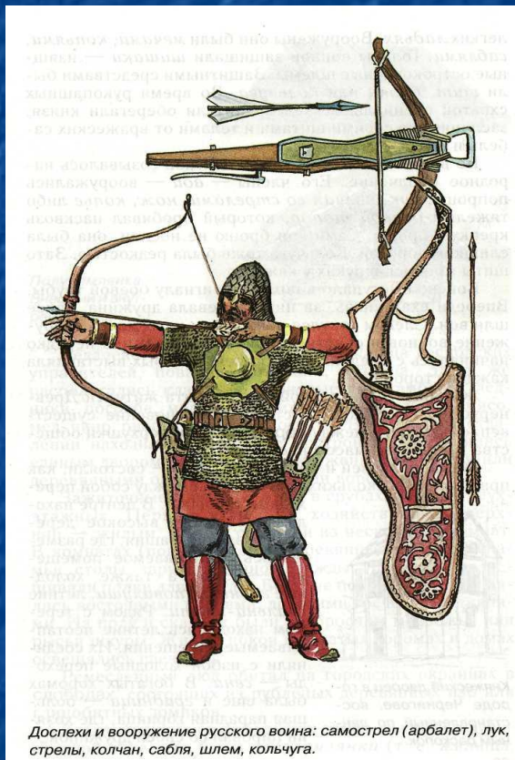
Доспехи и вооружение русского воина: самострел (арбалет), лук, стрелы, колчан, сабля, шлем, кольчуга.

Завоевания Чингисхана сопровождались беспримерной жестокостью. Передовые отряды завоевателей вышли в 1223 г. к Дону. Здесь они столкнулись с половцами.