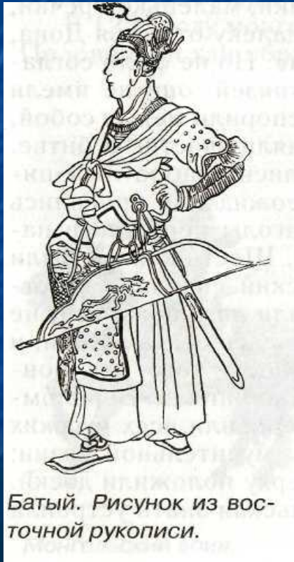
Батый. Рисунок из восточной рукописи.

Битва между русско-половецкими и монгольскими войсками произошла 31 мая 1223 г. на реке Калке. Однако не все русские князья, обещавшие участвовать в битве, выставили свои войска, некоторые опаздывали. Князья действовали недружно, киевский князь Мстислав Романович вообще стоял с войском в стороне, наблюдая, как изнемогают в бою дружины других князей. Битва закончилась поражением русско-половецких войск, многие князья и дружинники погибли. Поражения, равного этому, Русь еще не знала.