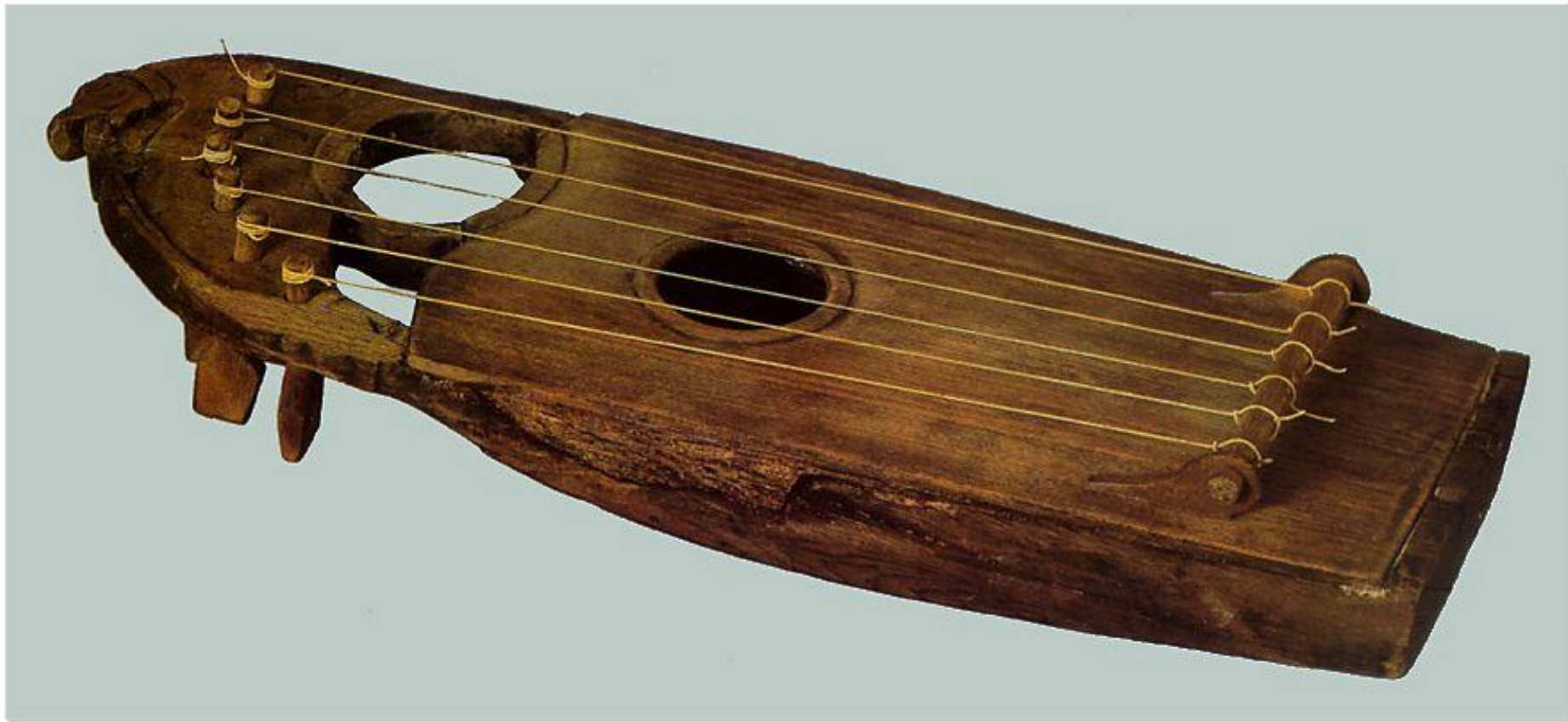
Гусли шестиструнные. Дерево. Длина 35,3 см. Первая половина XII в.