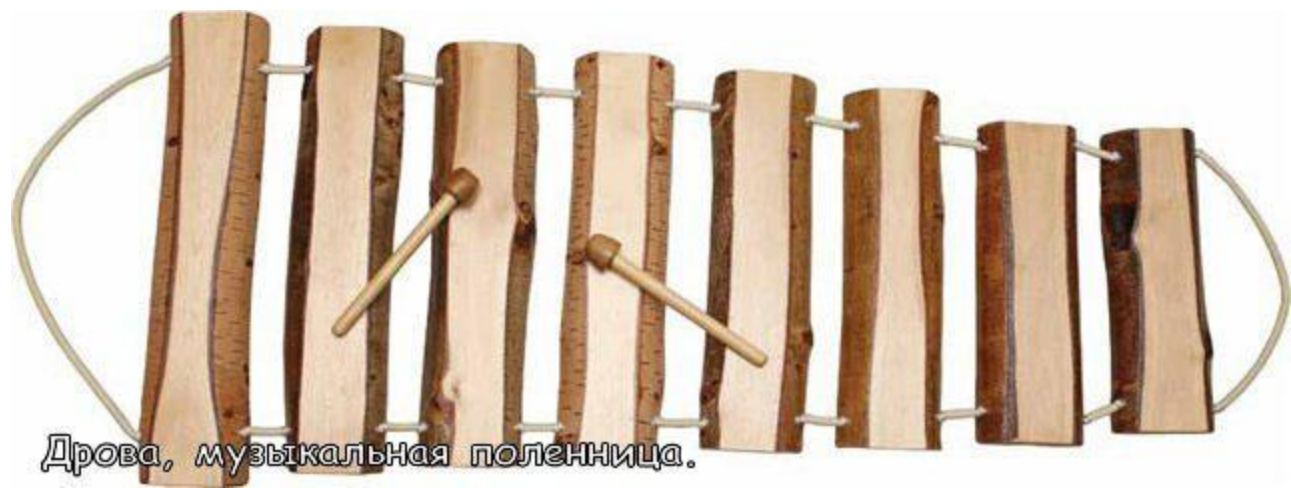
Дрова, музыкальная поленница.