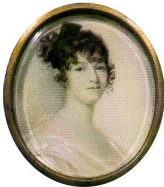
Н.О. Пушкина. 1800-е гг.

Мать, Надежда Осиповна , приходилась внучкой арапу Петра I, впоследствии русскому генералу Ганнибалу.