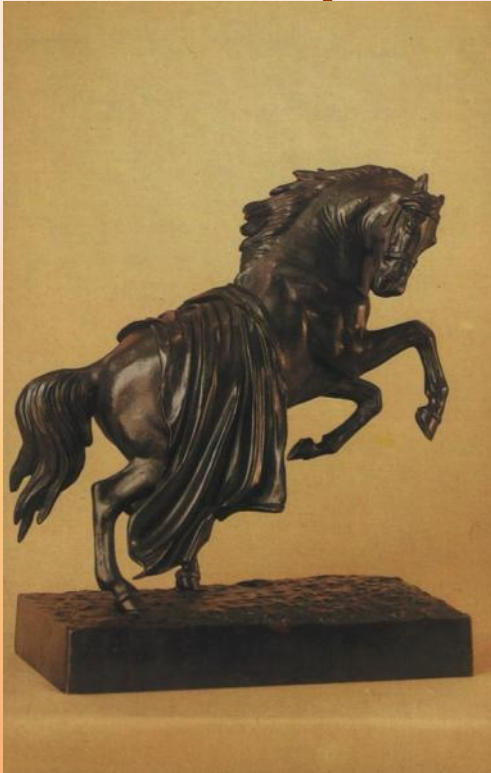
Вздыбленный конь. 1900