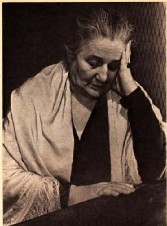
А. А. Ахматова. 1960