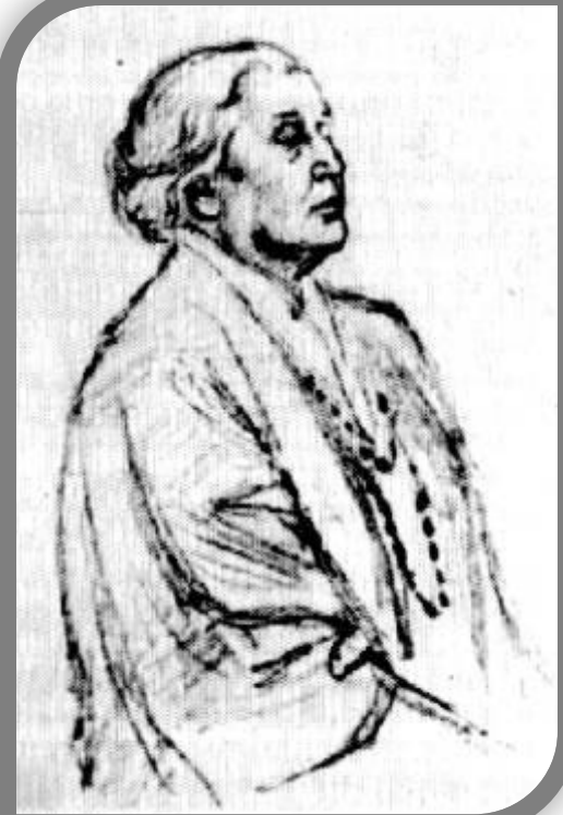
Фаворский В. А. Портрет А. А. Ахматовой. 1956