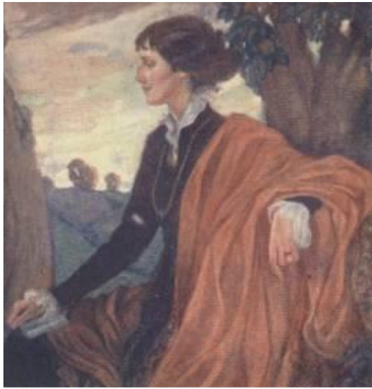
Делла-Вос-Кардовская О. Л. Портрет А. А. Ахматовой. 1914 Холст, масло.