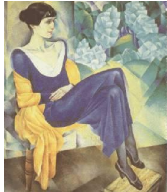
Альтман Н. И. Портрет А. А. Ахматовой. 1914